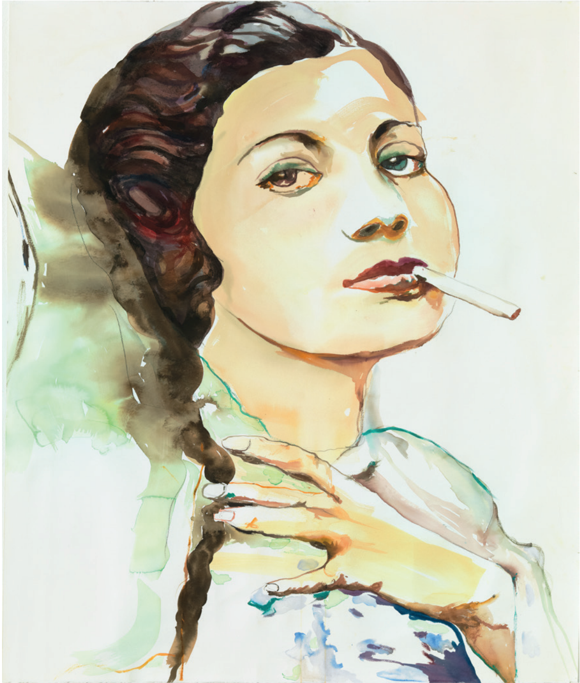
Cornelia Schleime: Aus der Reihe: see you (688), Aquarell, 2014, 113cm x 93cm