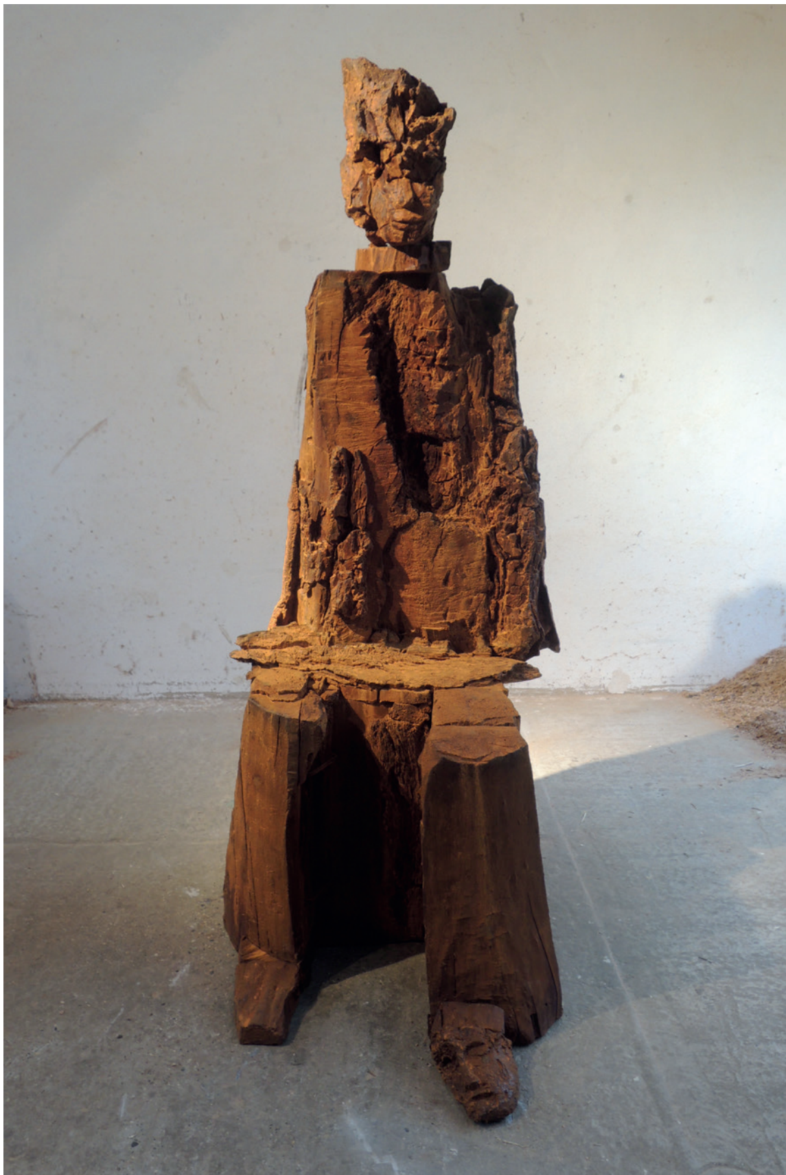
Dietrich Klinge: Der Schrei II (eRBe 20), Eisen, 2019, Höhe 2,26m