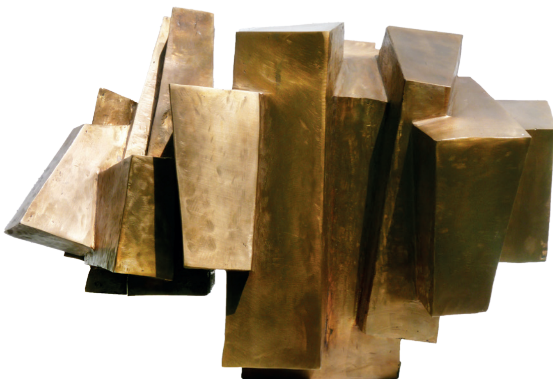
Fero Freymark: Großer Stein Guénolé, Bronze, 2012, 32cm x 50cm x 34cm