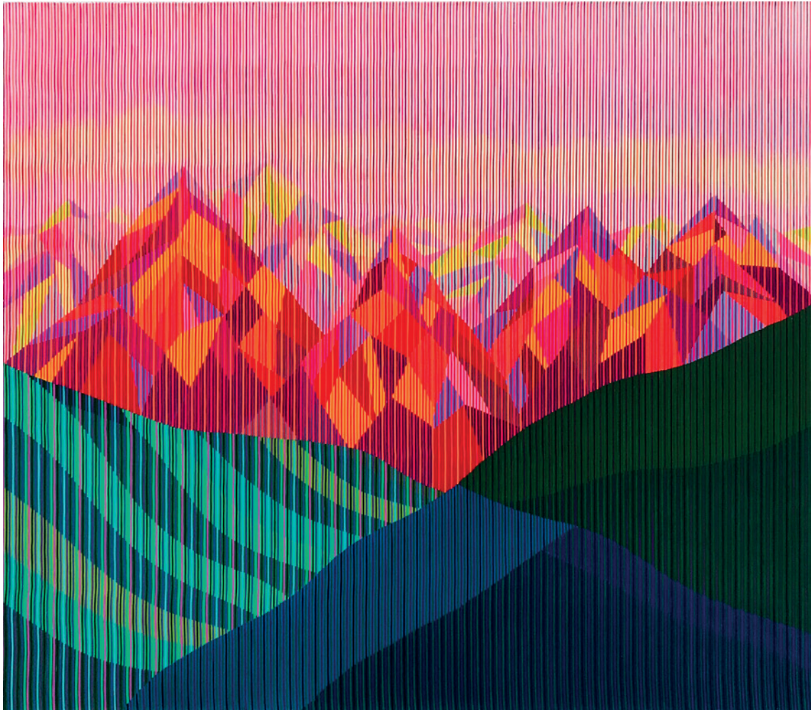
Antonio Marra: EBRU, Acryl auf Leinwand, 2020, 120cm x 140cm