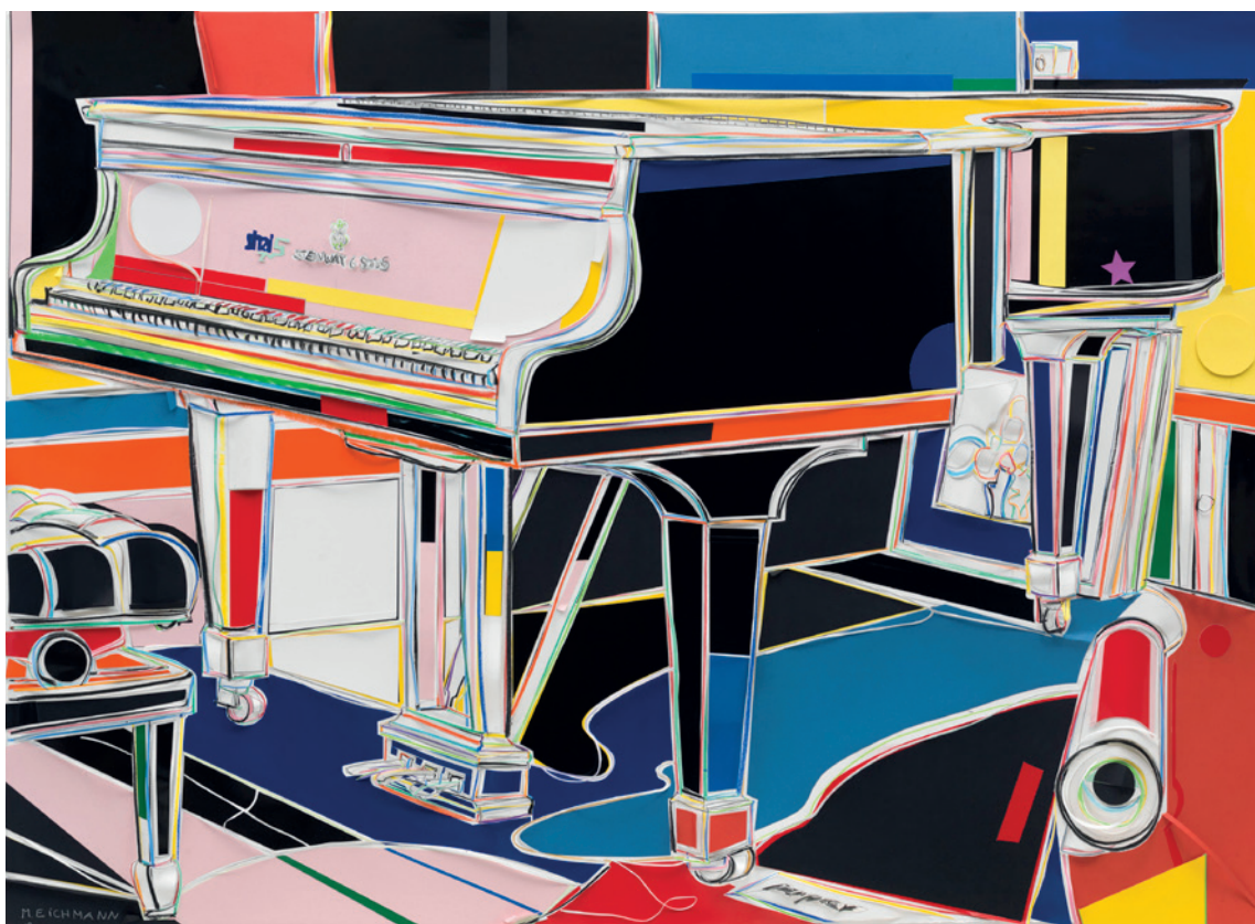
Marion Eichmann: Flügel, Papierschnitt, 2019, 132cm x 180cm