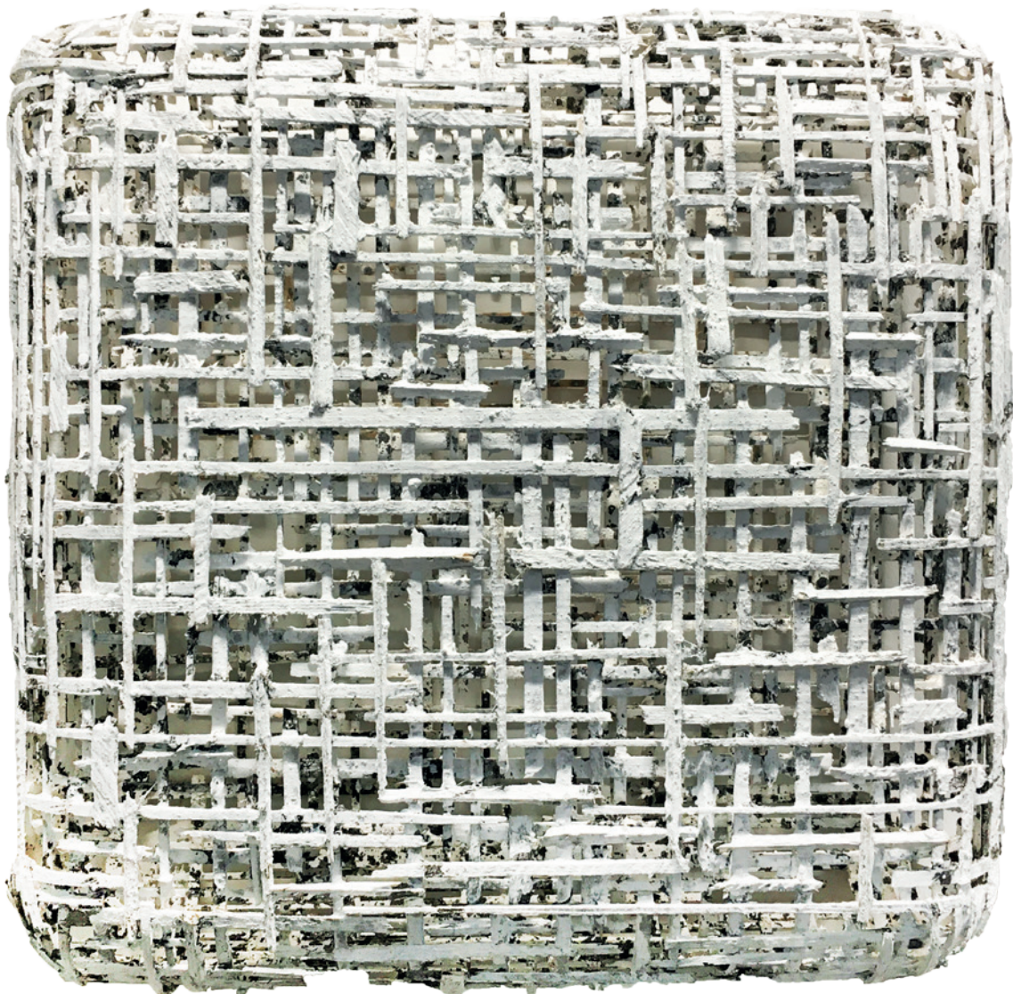
Willi Siber: Wandobjekt, Holz, 2012, 54cm x 54cm x 13cm