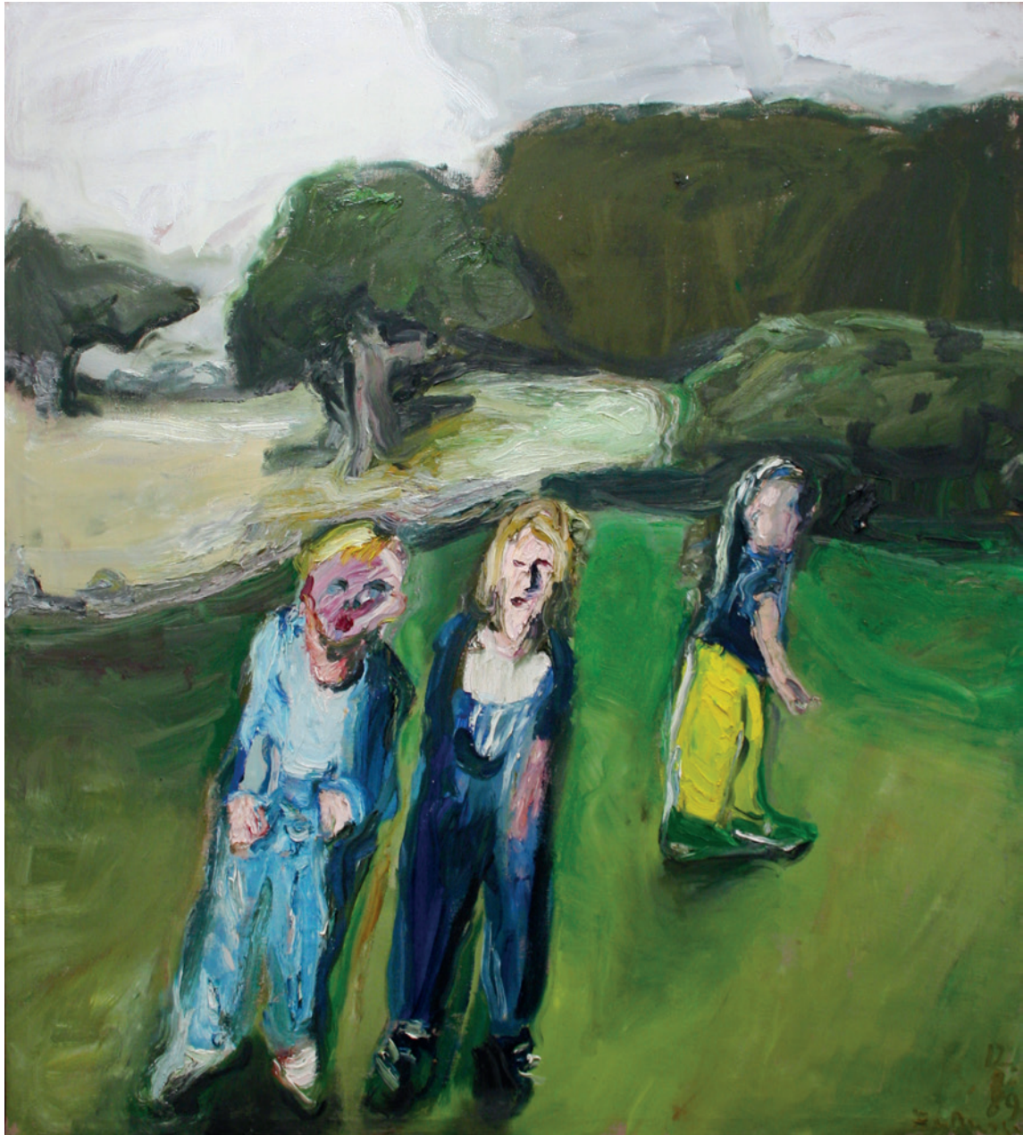
Klaus Fußmann: Drei Freundinnen auf Beveroe, Öl auf Leinwand, 1989, 200cm x 180cm