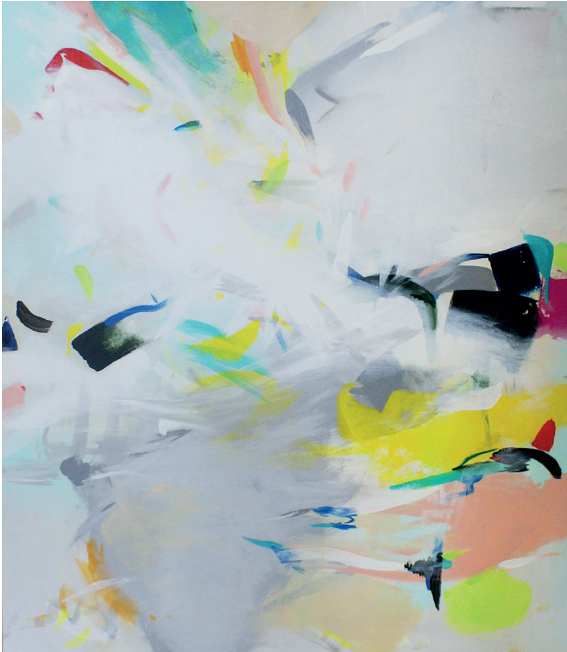
Michael Urtz: Licht II, Acryl auf Leinwand, 2015, 130cm x 110cm