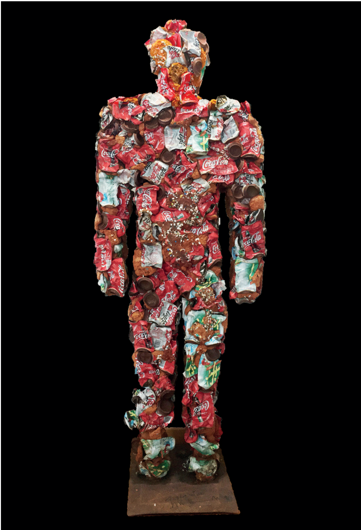
HA Schult: Trash Man, Mischtechnik, 1996, 180cm x 65cm x 18cm