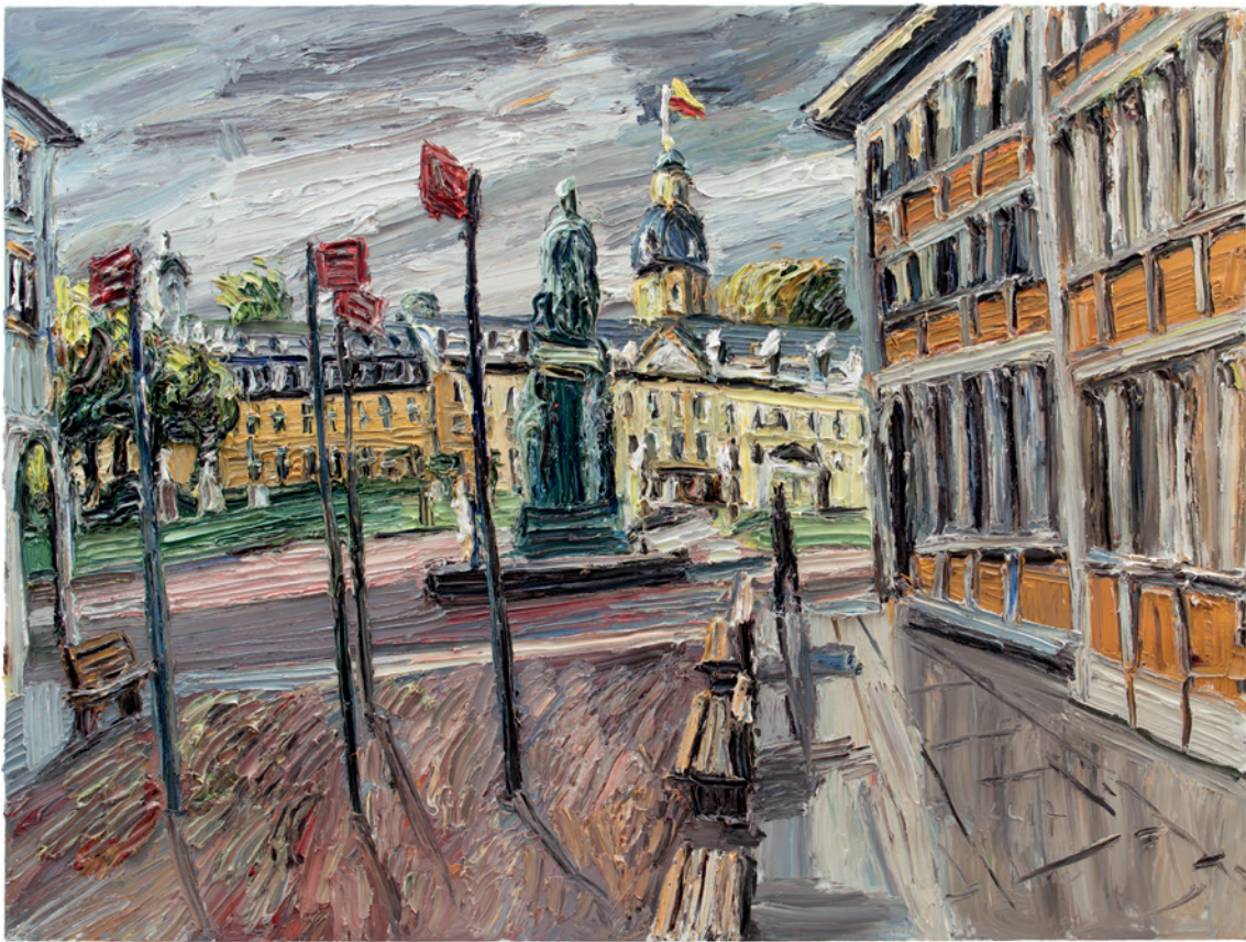
Christopher Lehmppuhl: Schloß nach dem Regen, Öl auf Leinwand, 2017, 180cm x 240cm