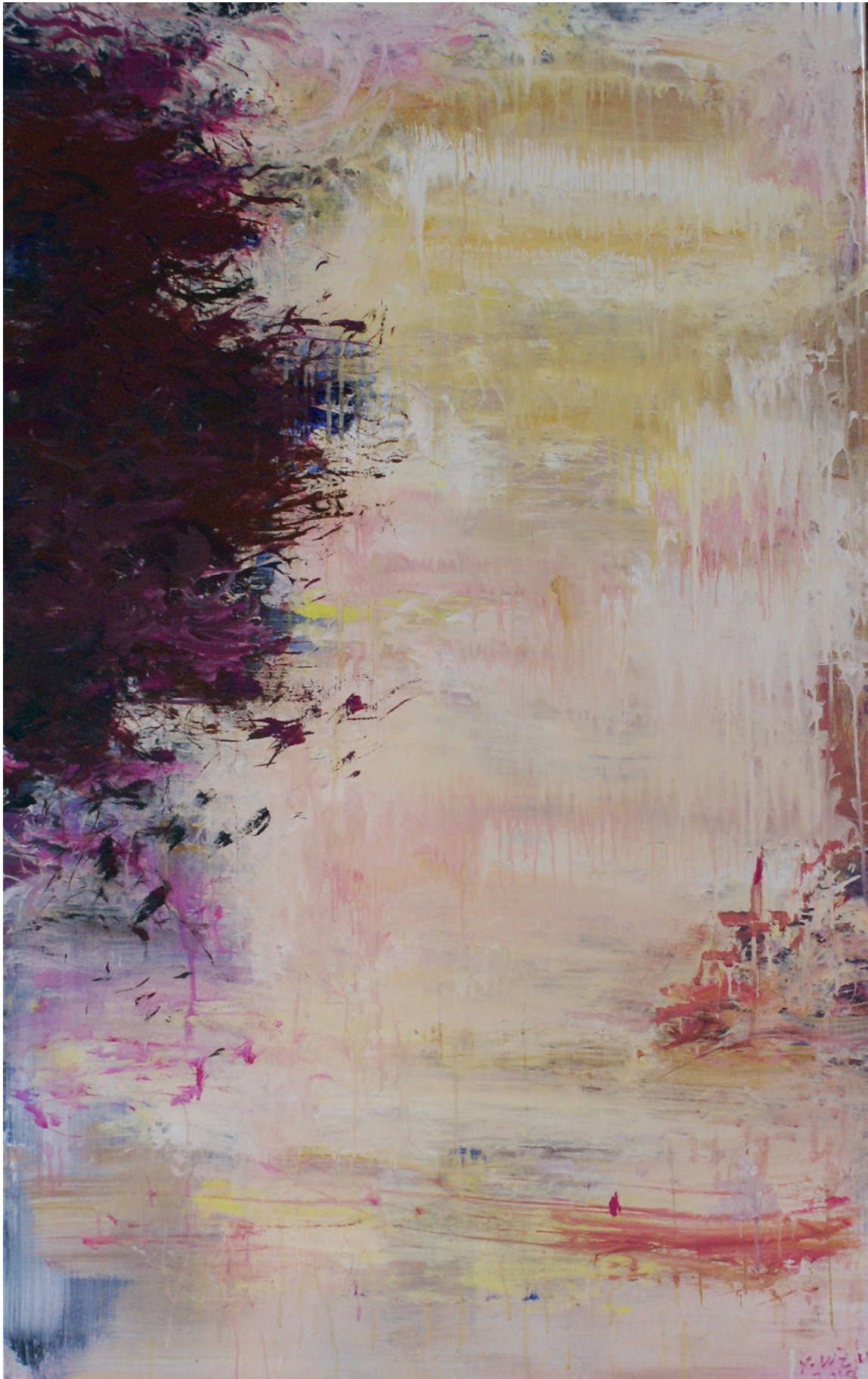
Xianwei Zhu: Abends II, Acryl auf Leinwand, 2018, 150cm x 90cm

Galerie Schrade · Schloß Mochental · 89584 Ehingen-Mochental · Fon 07375/418 · Fax -467 Galerie Schrade · Karlsruhe · Zirkel 34-40 · 76133 Karlsruhe · Fon 0721/1518-774 · Fax -778 schrade@galerie-schrade.de · www.galerie-schrade.de