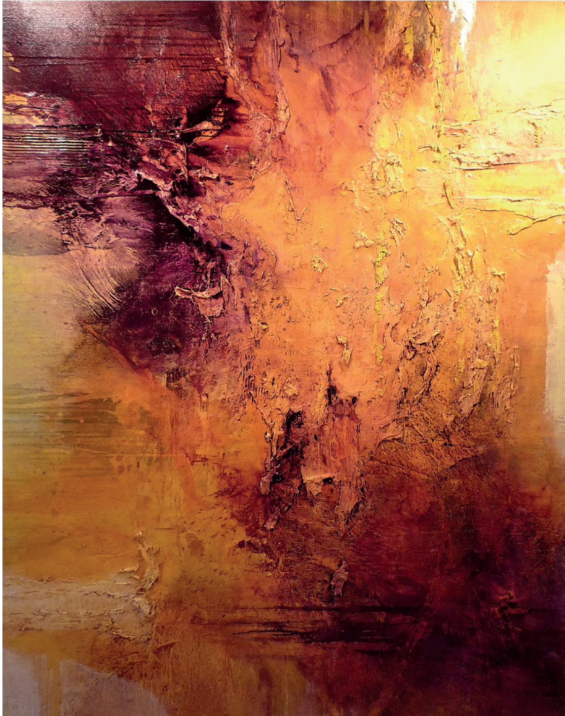
Peter Casagrande: 2011-8, 2018-20, Acryl auf Leinwand, 2011, 200cm x 160cm

Wir zeigen auf unserem angestammten Platz, Halle 2 Standnummer C35 und C30 Arbeiten folgender Künstler