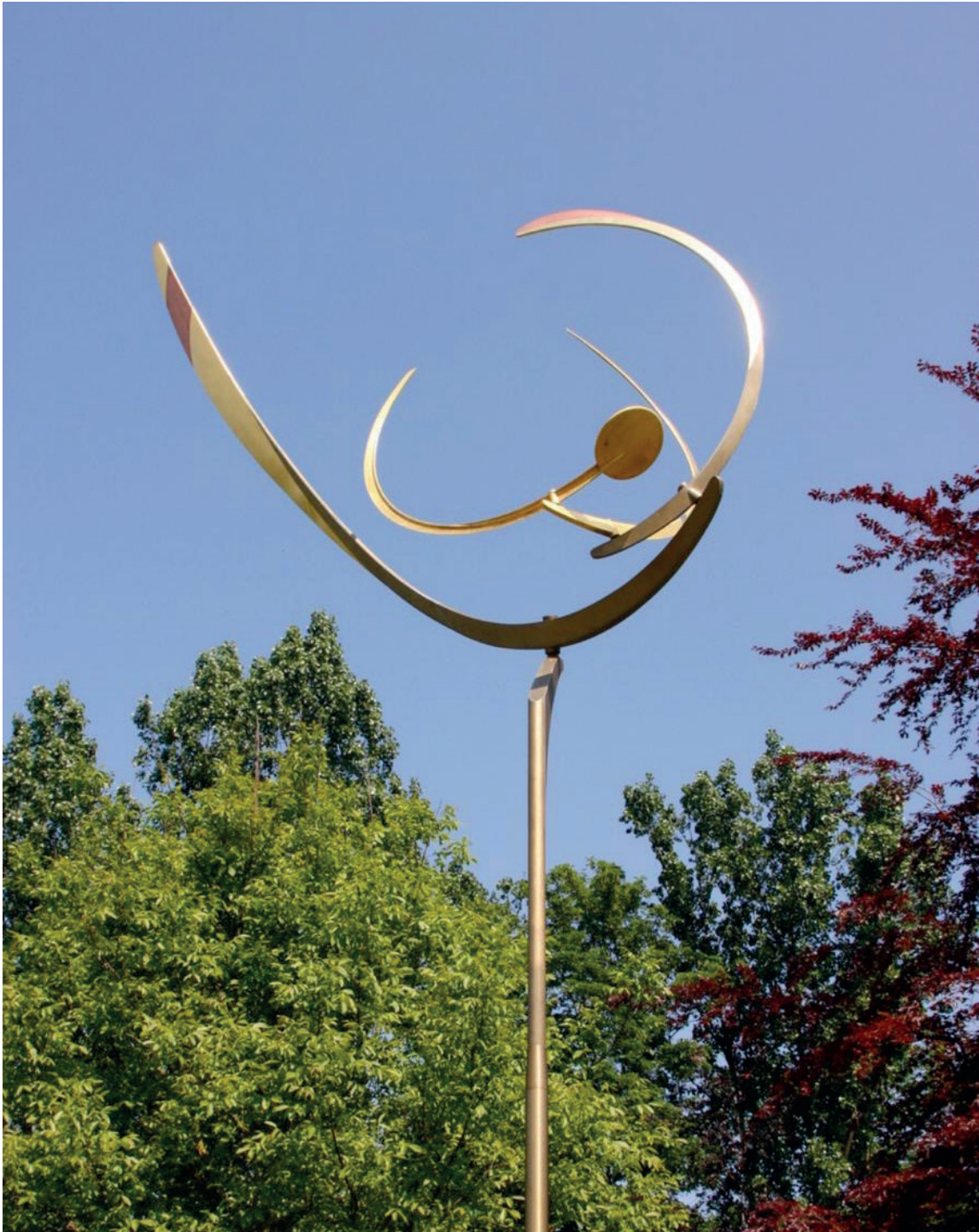
Jörg Wiele: Vier Halbrunde Leichtwind, Messing-Kupfer-Blattgold, 2008, 5-6x4m