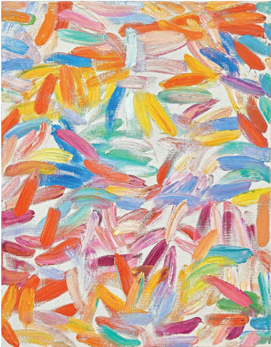
Ursula Jüngst: Hochzeit des Lichts I, Öl auf Leinwand, 2017, 90cm x 70cm