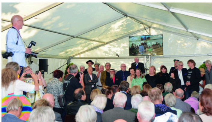
Das Geburtstagskind bittet seine Gäste im Festzelt zum Gruppenfoto auf die Bühne.

Wegen des weltweit ersten Besen-Museums wird wohl kaum ein Besucher ins prächtige Barockschloss Mochental bei Ehingen kommen. Auch wenn dort Alltägliches und Skurriles zu bestaunen ist vom Allgäuer Stubenbesen bis zum kenianischen Affenschwanzbesen. Ewald Schrade hat Humor. Natürlich darf in direkter Nachbarschaft zu Exponaten renommierter Künstler der Hinweis auf die kulturhistorische Linie nicht fehlen vom steinzeitlichen Höhlenbesen zum eigenwilligen Künstler-Pinsel. Das um 1730 erbaute dreiflügelige Schloss gehörte früher zum Kloster Zwiefalten. Dessen Äbte nutzten das malerisch auf einem Hügel gelegene Anwesen als Sommersitz. Seit 1985 ist das Schloss in Ehingen-Kirchen Hauptsitz der Galerie Ewald Karl Schrade mit einer Ausstellungsfläche von gigantischen 2800 Quadratmetern.