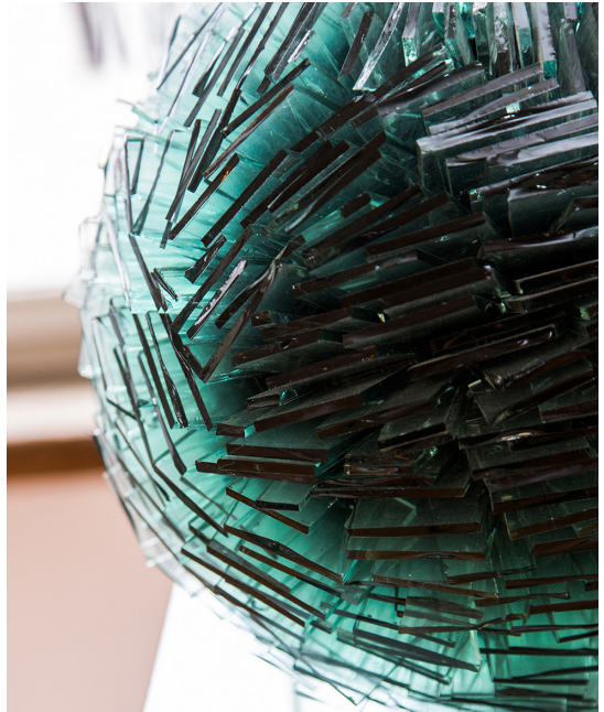
Detail von Kugel, Glas, 2013, d 30 cm