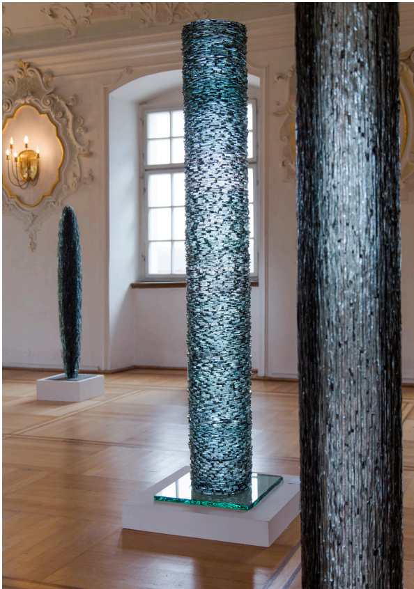
v.l.: Zyro, Glas, 140 x 18 cm; großer Zylinder, 2014, Glas, 190 x 28 cm; Zylinder (senkrechte Schichtung), Glas, 190 x 26 cm