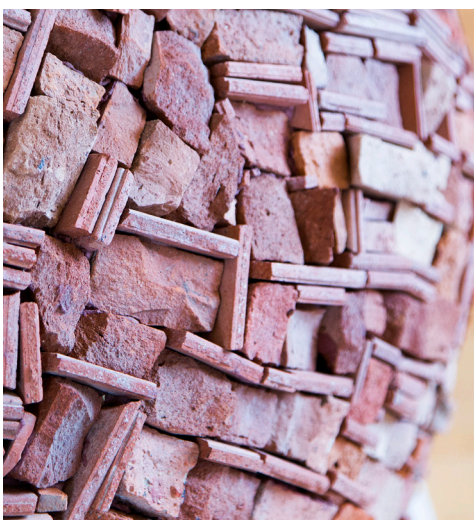
Detail von Pallo Grande, 2013, tosk. Antikziegel, d 90 cm