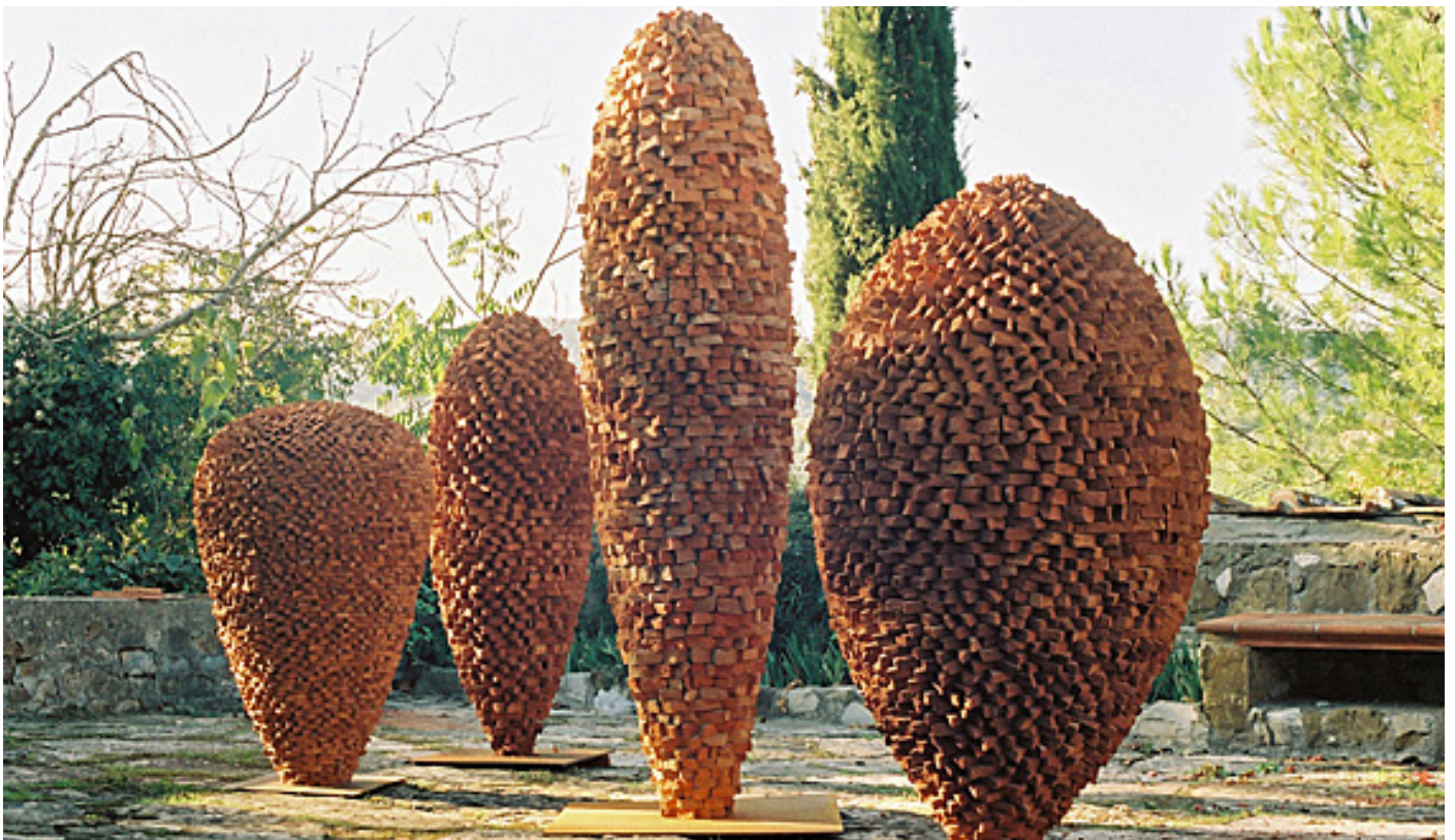
Siena, Ziegel, 2008, verschiedene Größen