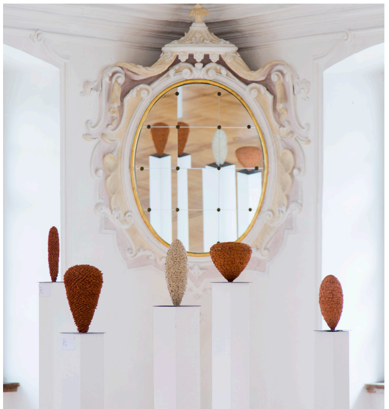
Blick in die Ausstellung Schloß Mochental 2014