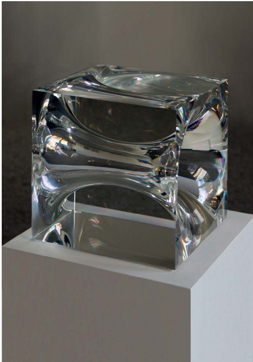
Uli Pohl, Würfel VI-87, Acrylglas, 23,3 x 23,3 x 23,3 cm, WVZ 117

„Die Formulierung: >>Bestimmt ist mein Produzieren durch die Tendenz zur Klarheit, Kontrollierbarkeit und Ordnung<<, bezog sich nie vordergründig auf die Transparenz des von mir verwendeten Materials, sondern vielmehr auf die Nachvollziehbarkeit der Konzeption, die jedem Werk zugrunde liegt. (...) Das setzte voraus, daß ich sehr bewußt auf einen neuen Betrachter hin arbeitete. Ich will damit sagen, einen Rezipienten, der gewillt ist mit Kunst aktiv umzugehen, der aktiv und selbstbeteiligt schaut, denkt, frägt, sucht und forscht.“