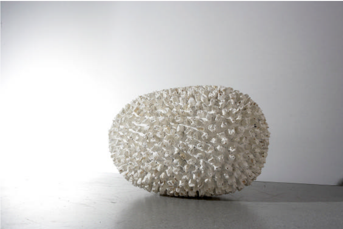
Bodenarbeit, 2008, Holz/Emulsion, 65 x 80 x 65 cm

„Ich übernehme die an sich ausgewogenen Grundform des Eies, besetzte sie aber mit splissigem Holz, so dass ihre ursprünglich totale Stimmigkeit durchkreuzt und in eine andere Ebene überführt wird.“