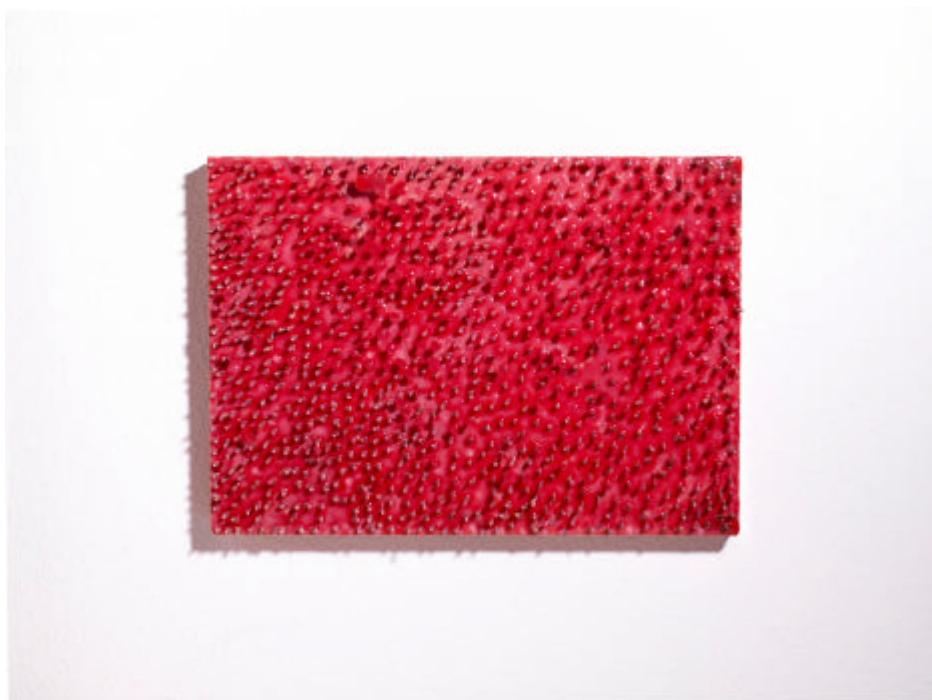
Tafelobjekt, 2009, Holz/Metall/Harze, 40 x 55 cm

„Ich bin überzeugt von der Assoziations- und Suggestivkraft einer reduzierten Formensprache. Zunächst einmal sind meine Arbeiten äußerst wandelbar. Das heißt: Bedingt durch unterschiedliche Licht- und Schattenwirkungen und die sich wandelnden Betrachterstandorte (...) weisen die Kunstwerke im Ausdruck eine Bandbreite auf, die von ruhig und meditativ bis zu expressiv und energetisch aufgeladen reicht.“