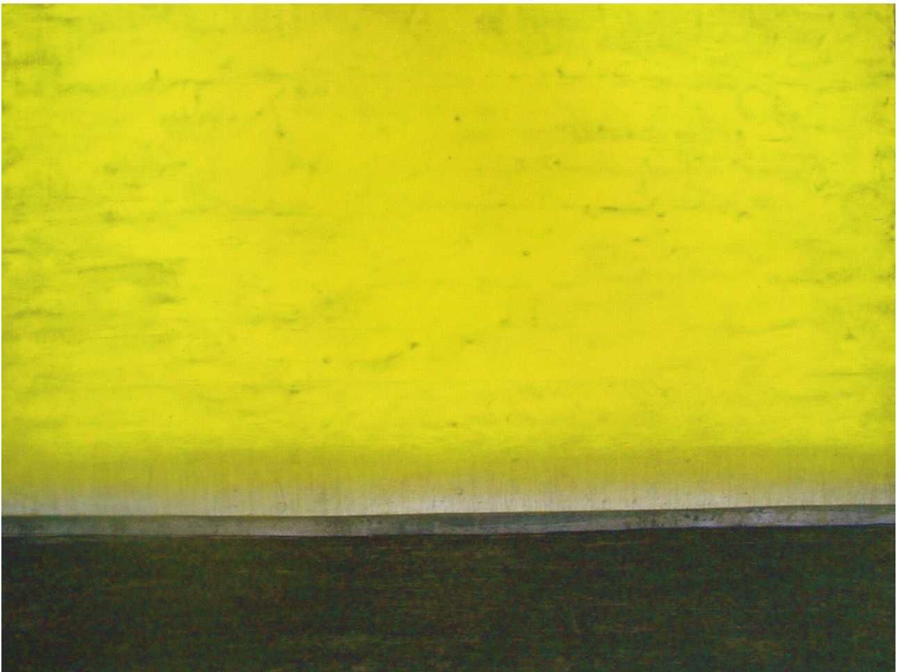
lanscape II, 2009, Öl/ Blei/ Holz, 61 x 76 cm