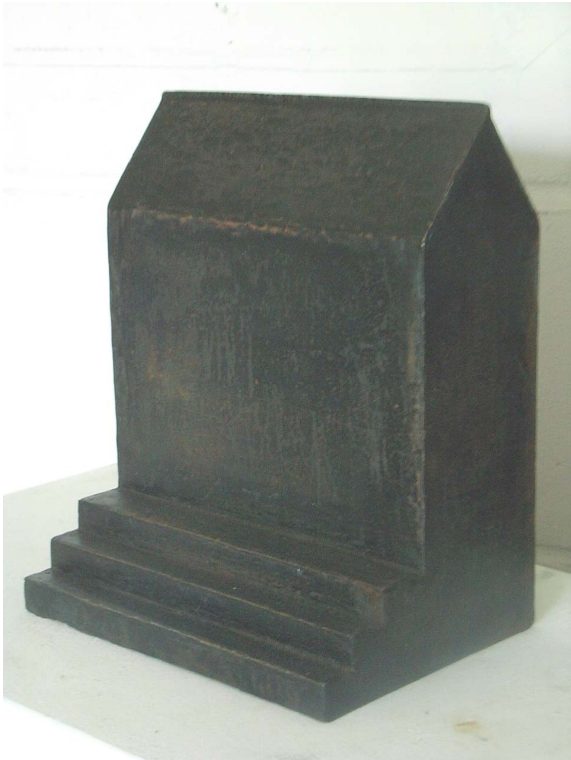
CASA, 2009, Eisenguß, patiniert, 29,5 x 24 x 18 cm

Aktuelle Bilder zur Ausstellung zum Runterladen und weitere Informationen finden Sie auf unserer Homepage unter www.galerie-schrade.de .