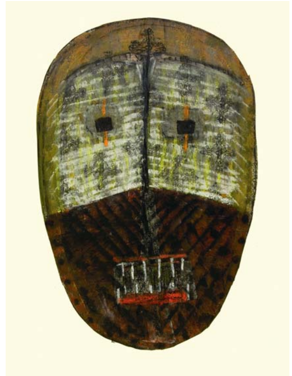
Aus dem Zyklus FACES I. - XIV., 2007, Mischtechnik/ Collage auf Papier, 78 x 80 cm