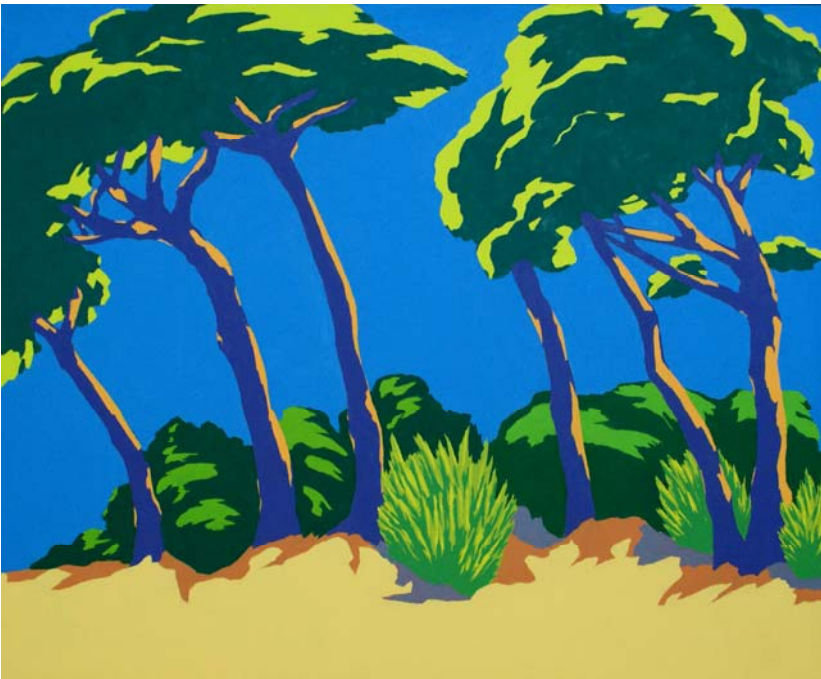
Pinien, 2008, Öl/Lw, 90x110 cm