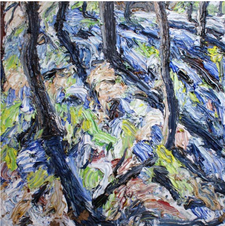
Frühling im Tiergarten, 2009, Öl/Lw, 120x120 cm