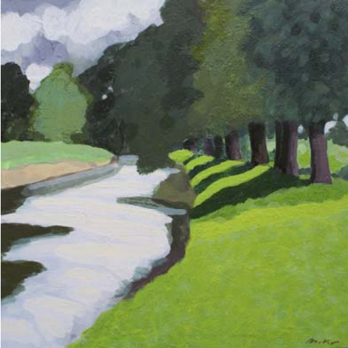
Donau bei Öpfingen, 2009, Pigment/Acryl/Karton, 25 x 25 cm