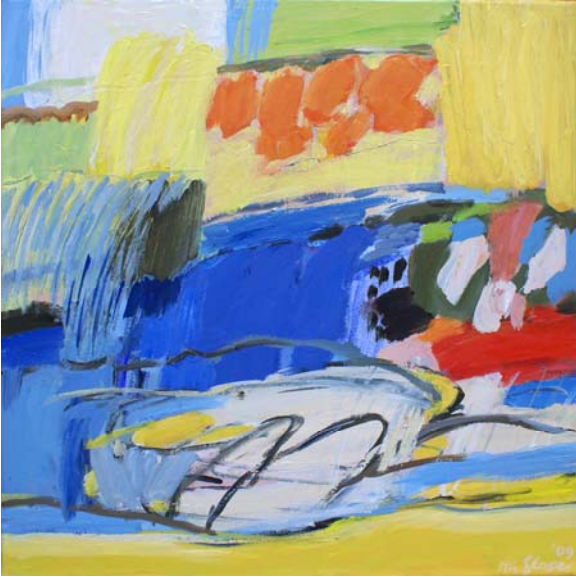
Frühling, 2009, Öl/Lw, 50x50 cm