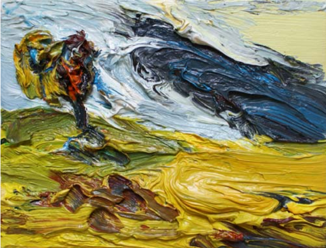
Baum, 2008, Öl/Lw, 41x31 cm