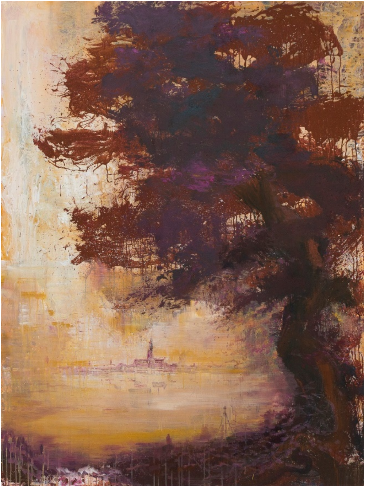
Rückkehr zu den Wurzeln I, 2018, Acryl auf Leinwand, 200 x 150 cm