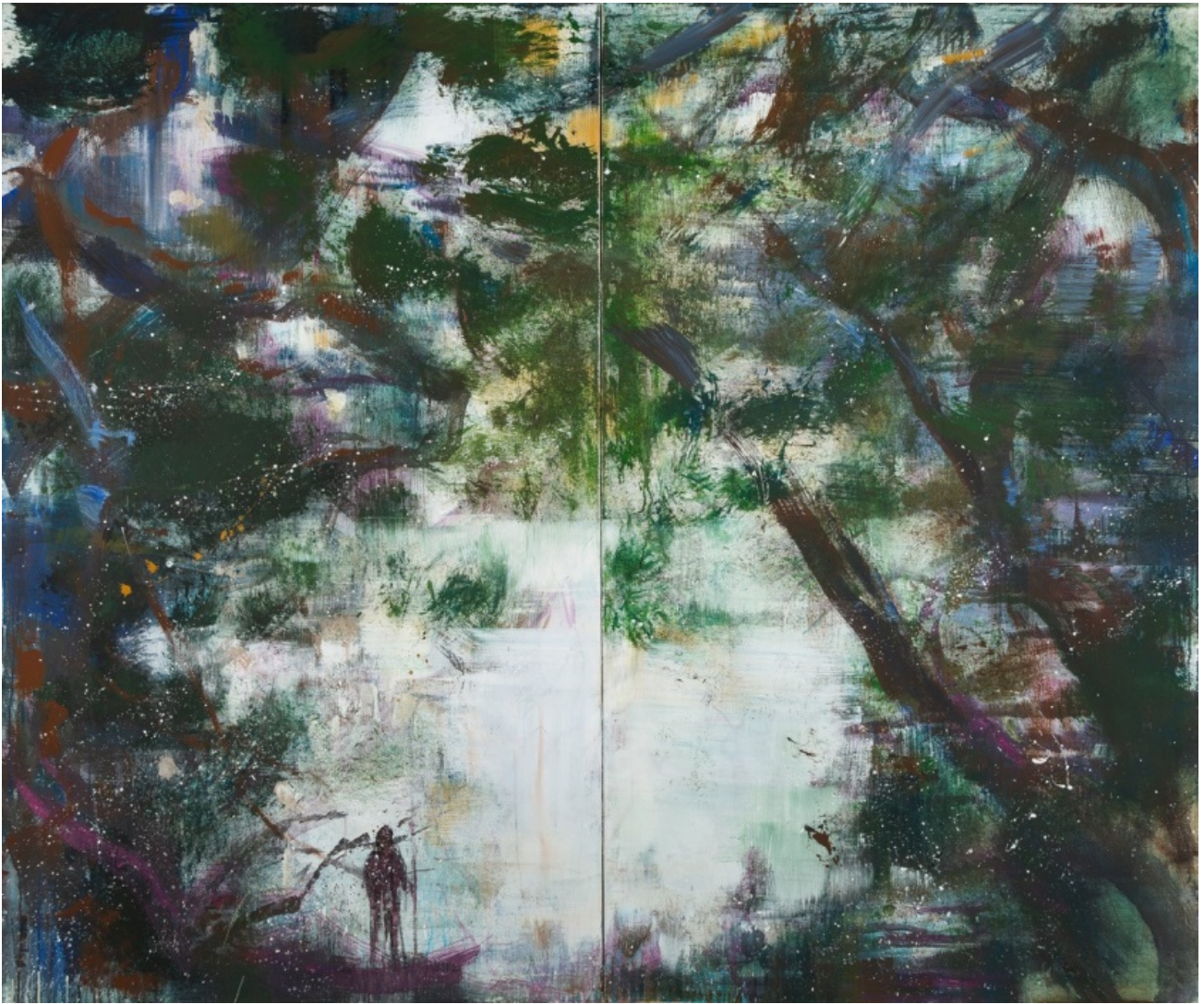
Am Anfang, 2018, Acryl auf Leinwand, 150 x 180 cm