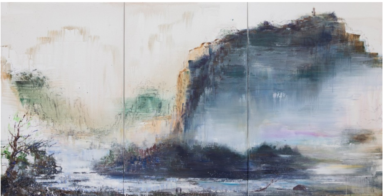
An der Quelle, 2018, Acryl auf Leinwand, 116 x 227 cm (3-teilig)