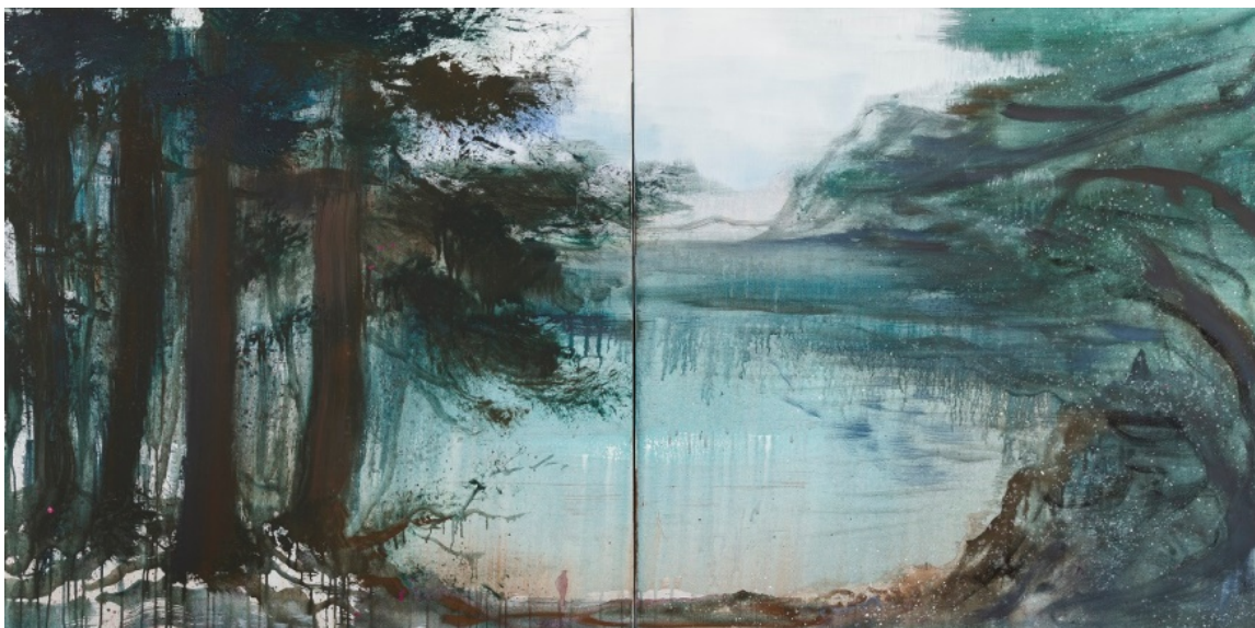
Ursprung, 2018, Acryl auf Leinwand, 100 x 200 cm

Dienstag bis Samstag 13 - 17 Uhr Sonn- und Feiertage 11 - 17 Uhr