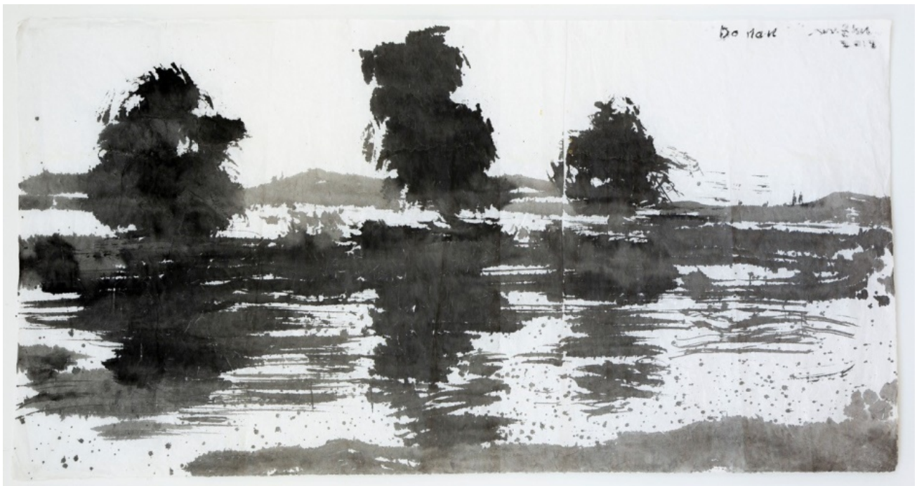
Aus der Serie: „Elementar Donau“, 2018, Tusche auf chinesischem Papier, 143 x 74 cm