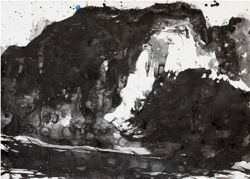
Großer Klang, 2018, Mischtechnik auf Papier, 50 x 70 cm