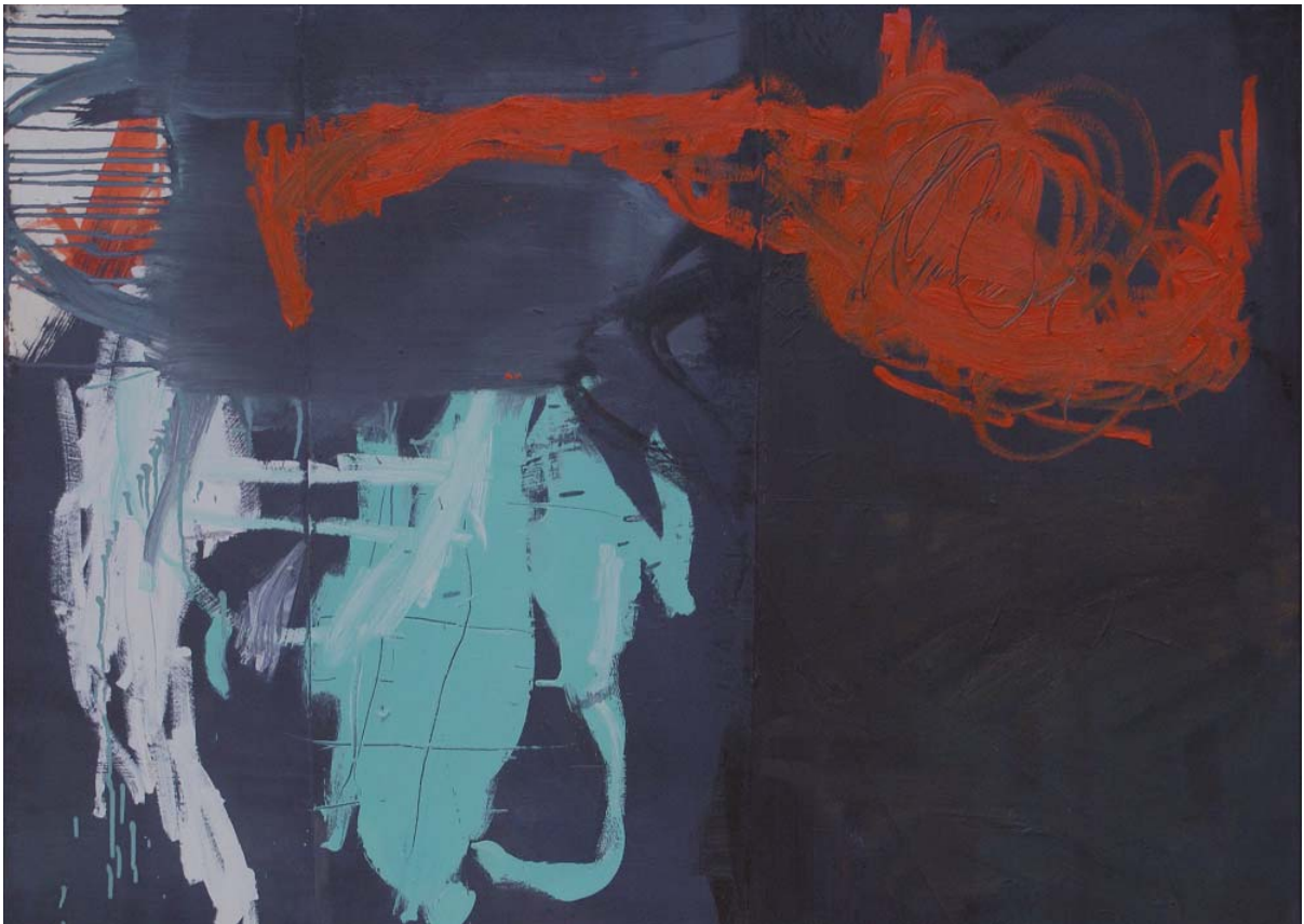
Einladungstitel: o.T., 1985, Öl auf Papier collagiert, 72 x 97 cm