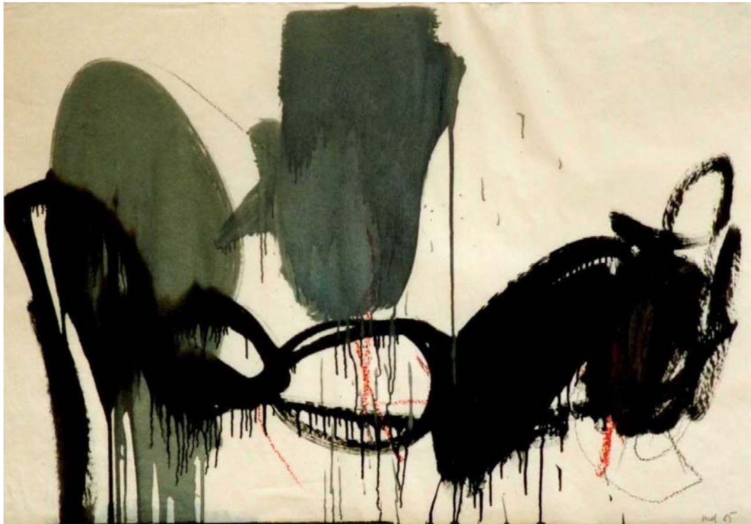
o.T., 1985, Mischtechnik auf Papier, 62 x 88 cm