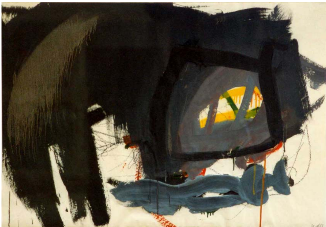
o.T., 1985, Mischtechnik auf Papier, 62 x 88 cm