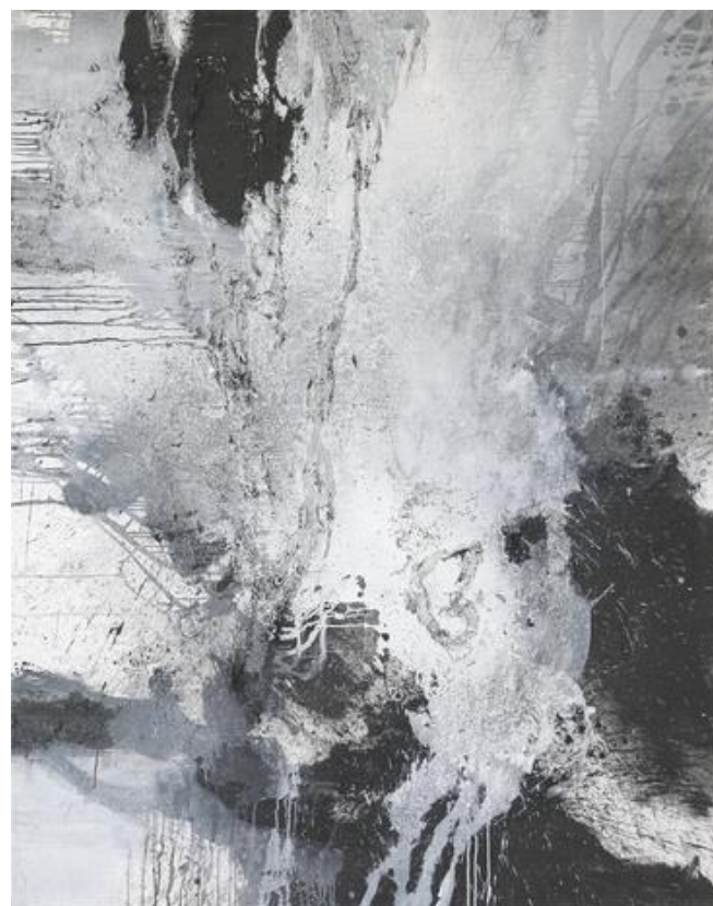
Casagrande, Peter: 17, 2017 Acryl auf Leinwand, 200 x 160 cm