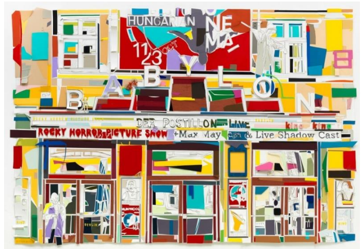
Eichmann, Marion: BABYLON, 2018 Papierschnitt, 126 x 196 cm