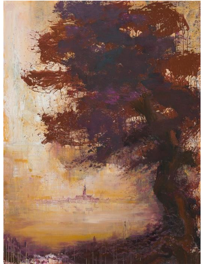
Zhu, Xianwei: RÜCKKEHR ZU DEN WURZELN I, 2018 Acryl auf Leinwand, 200 x 150 cm