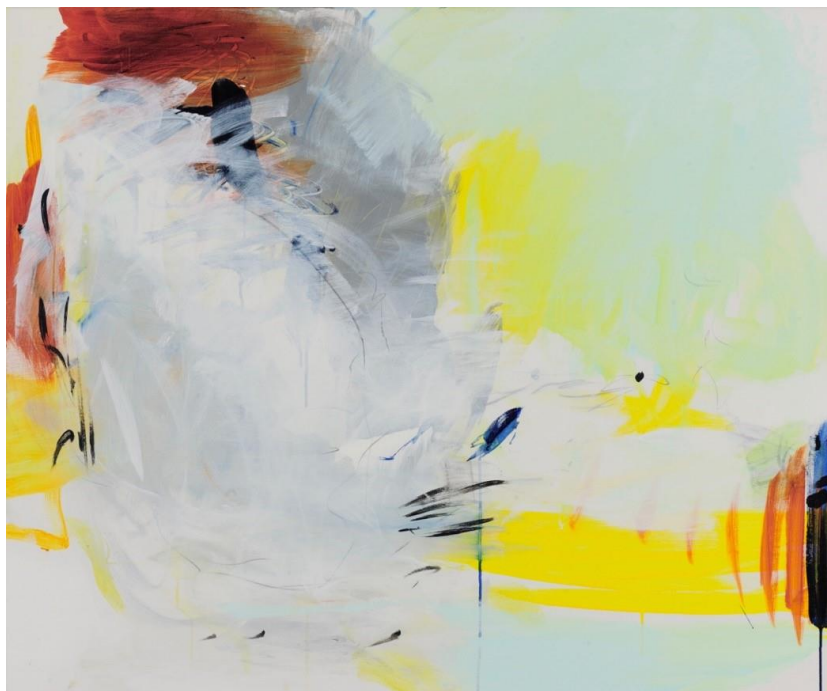
Urtz, Michael: KASKADE I, 2018 Acryl auf Leinwand, 100 x 120 cm