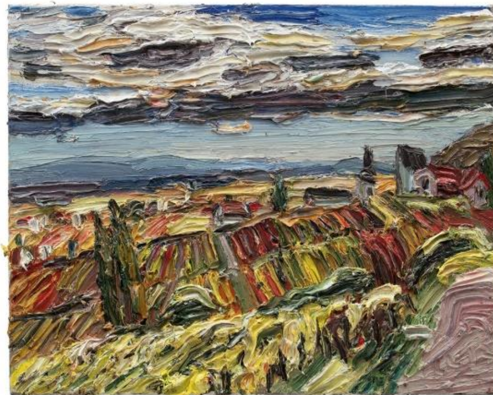
Lehmpfuhl, Christopher: WEITE, 2012 Öl auf Leinwand, 160 x 180 cm