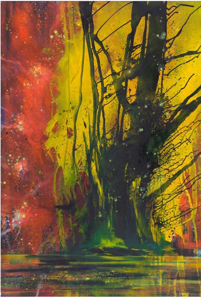
Zimmer, Bernd: HOCHSPANNUNG / SONNENWEND 2016/17, Acryl auf Leinwand, 270 x 200 cm