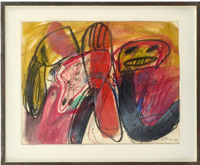
Stöhrer, Walter: JUDITH UND DIE G., 1966 Mischtechnik auf Papier, 54,5 x 69,5 cm