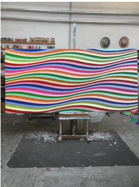
Antonio Marra; ANATOMIE EINES AUGENBLICKS, 2019 Acryl auf Leinwand, 120 x 250 cm