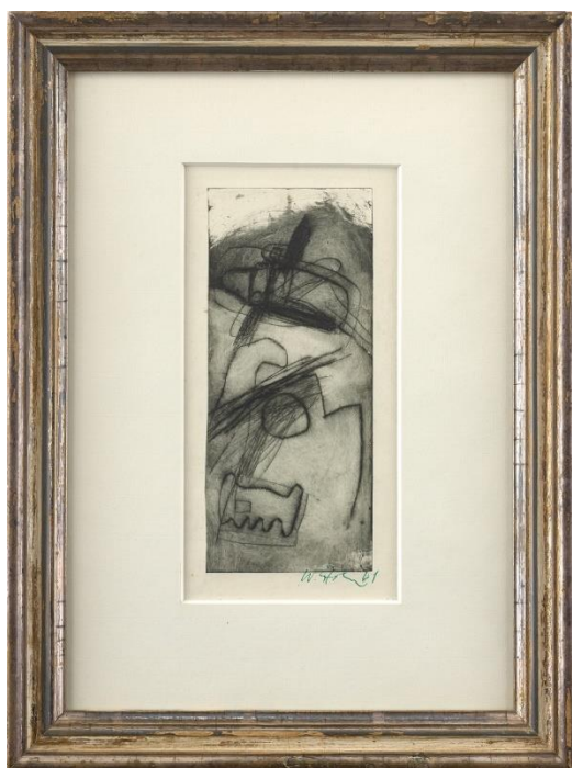
Stöhrer, Walter: o.T., 1961 Radierung auf Bütten, 25 x 11 cm