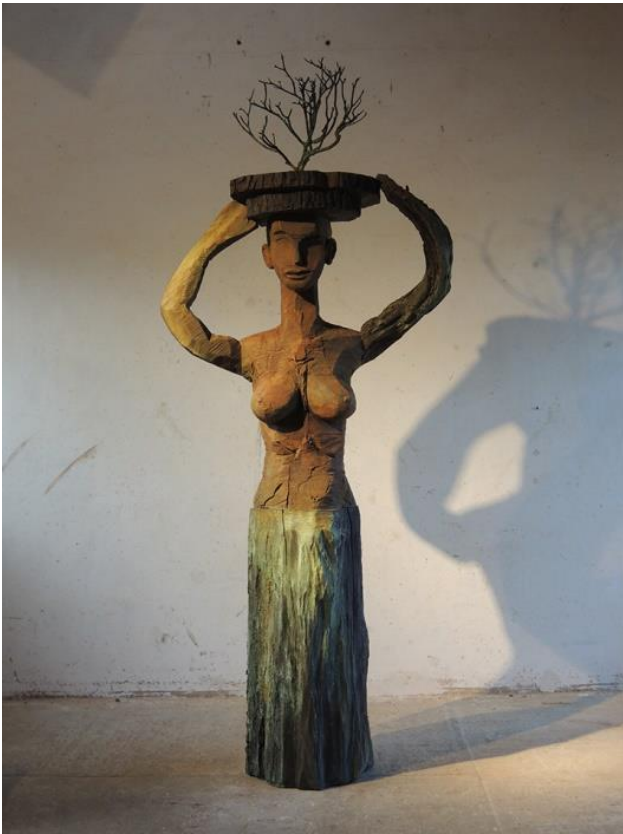
Klinge, Dietrich: KORE IV, 2017 Bronze, 293 x 120 x 55 cm