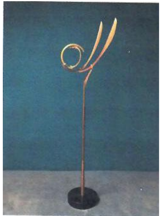
Wiele, Jörg: VIER HALBRUNDE, 2018 Kupfer, Messing, Blei, Stahl u.a., Granitsockel Höhe: ca. 3,5 m, Bewegungsdurchmesser: 1,2 m