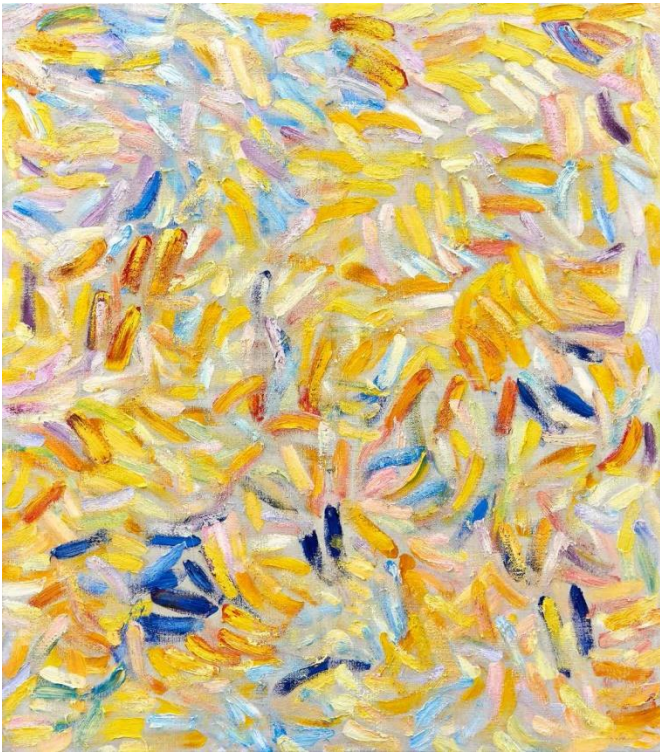
Jüngst, Ursula: SONNENGESANG, 2018 Öl auf Leinwand, 165 x 145 cm

Hier haben wir für Sie einen kleinen Bilderbogen zusammengestellt. Als Vorgeschmack auf einige Künstler-Positionen, die wir Ihnen auf der art KARLSRUHE 2019 zeigen! Viel Freude damit.