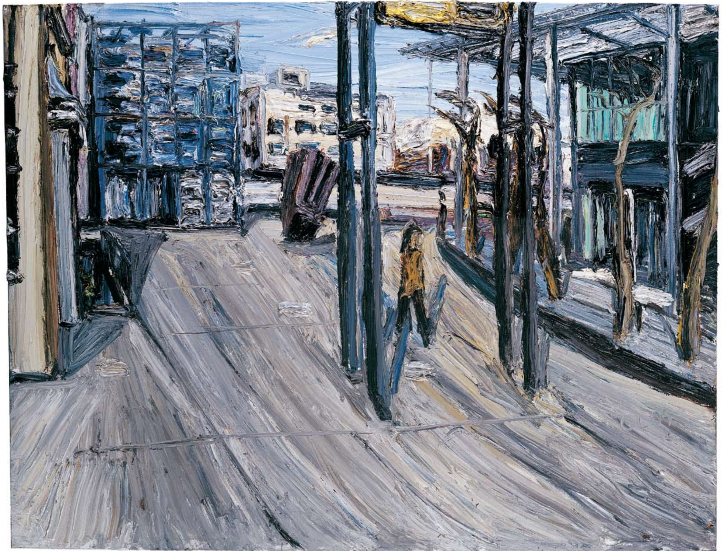
ZKM Karlsruhe 2009 Öl auf Leinwand 180 x 240 cm