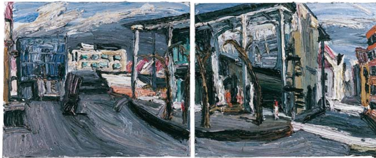
Licht und Schatten · 2009 · Öl auf Leinwand · je 100 x 120 cm