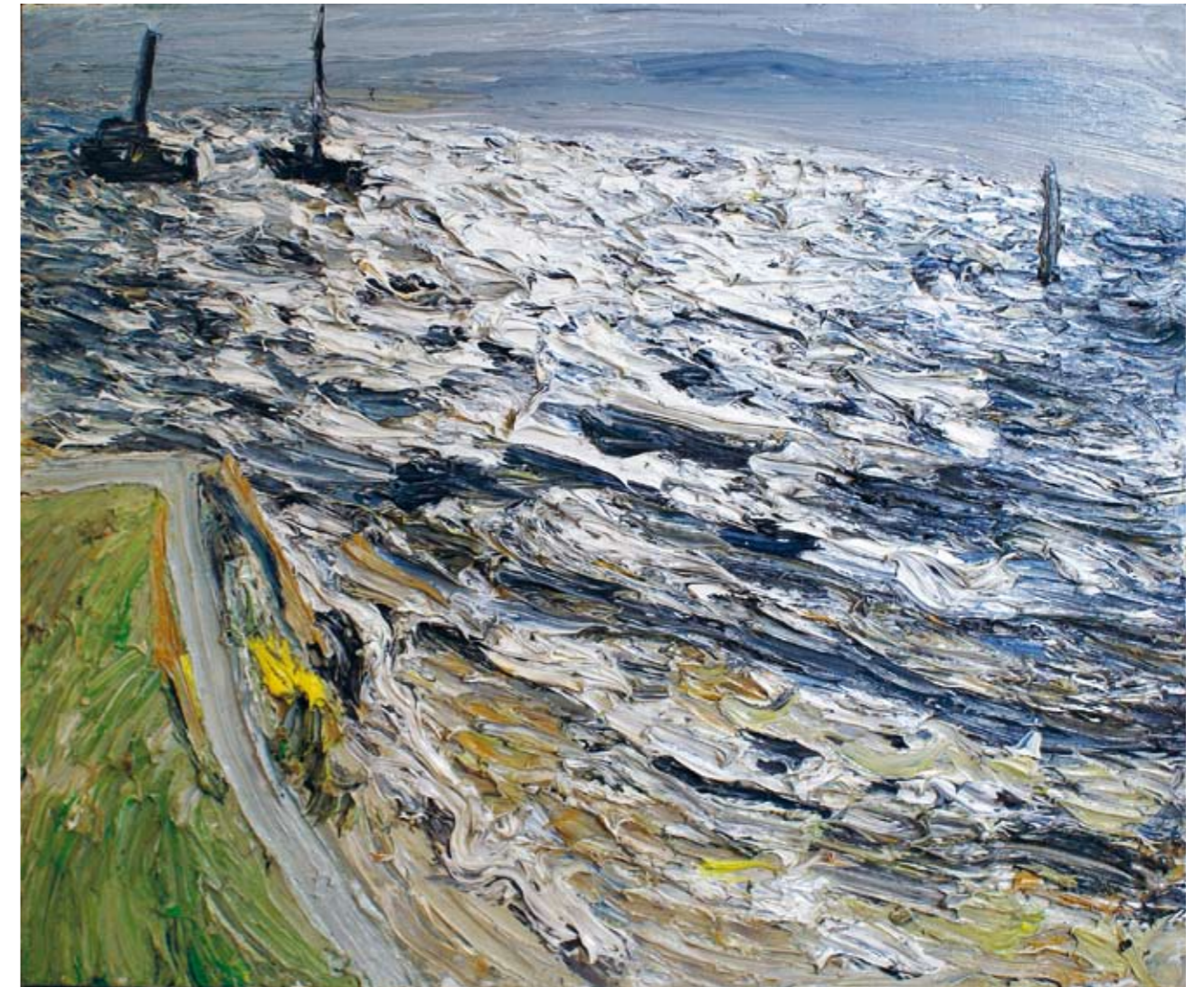
Gegenlicht I 2009 Öl auf Leinwand 100 x 120 cm