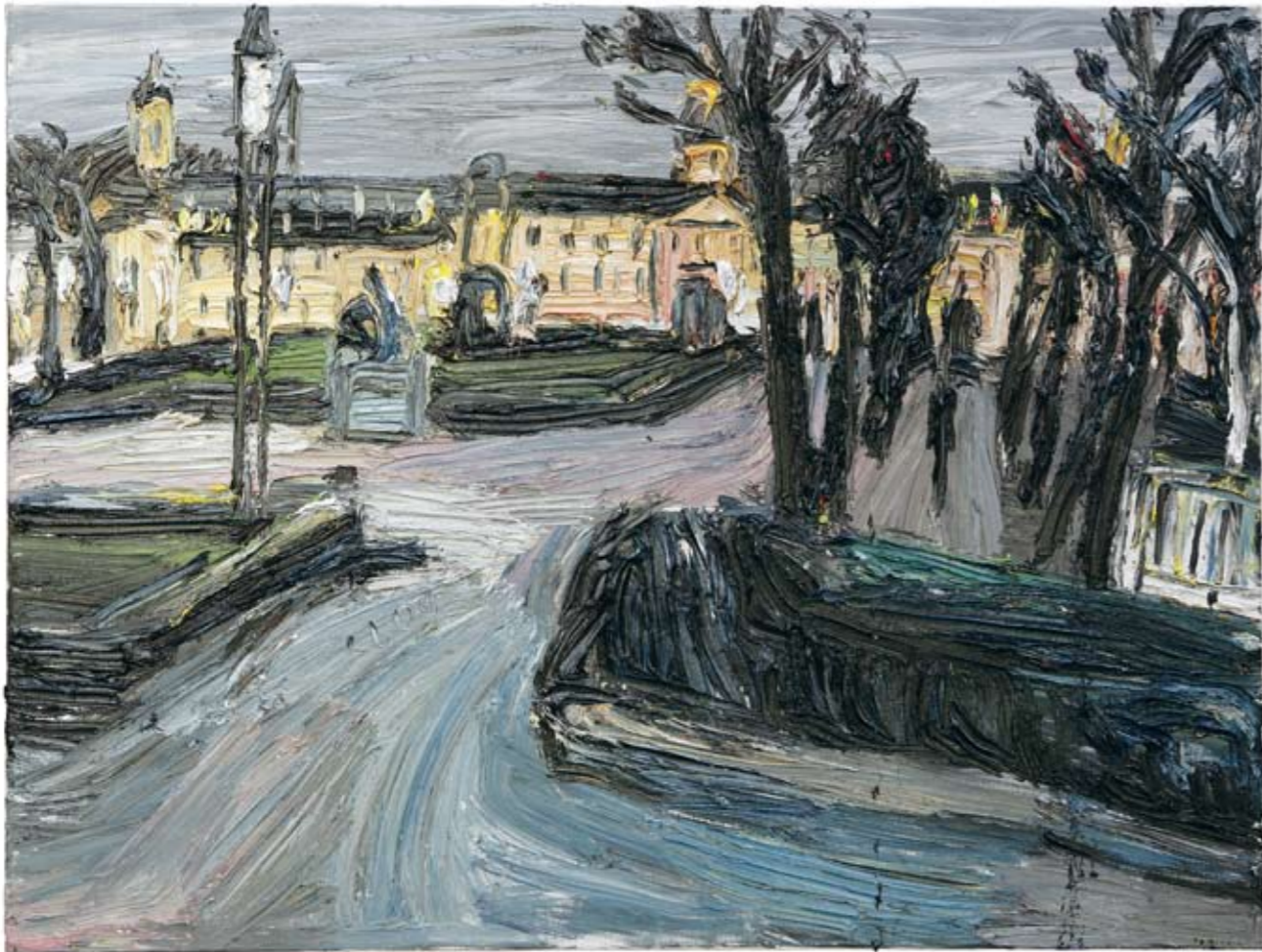
Schloss am Abend 2009 Öl auf Leinwand 180 x 240 cm