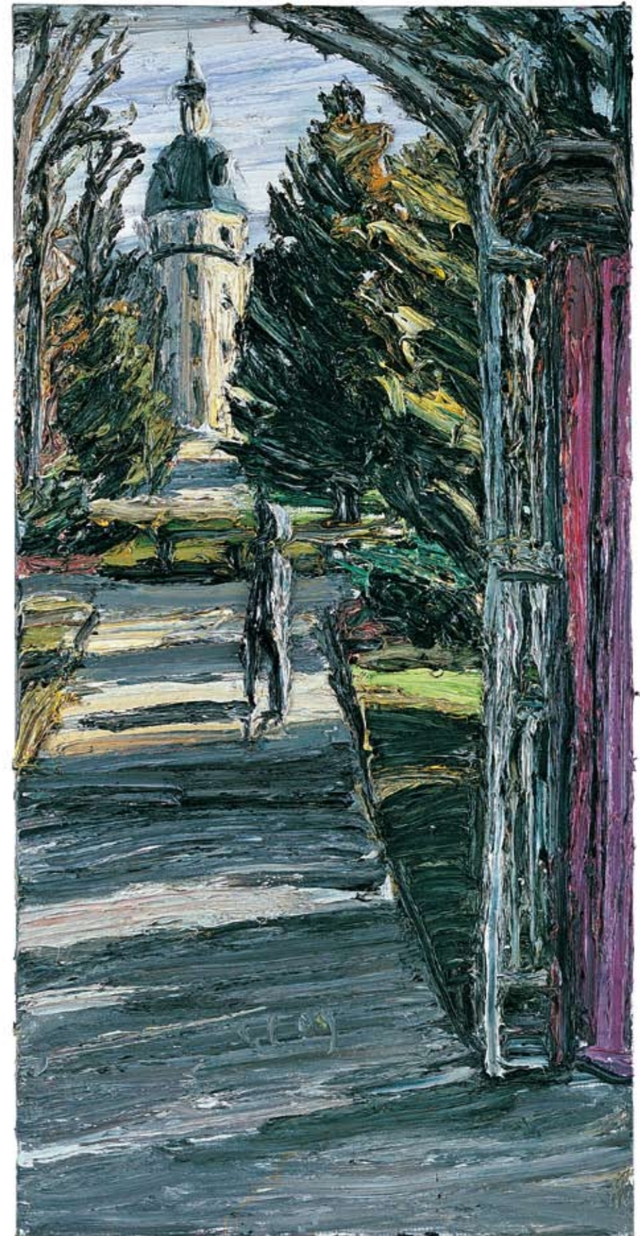
Sonniges Schloss Karlsruhe 2009 Öl auf Leinwand 180 x 80 cm