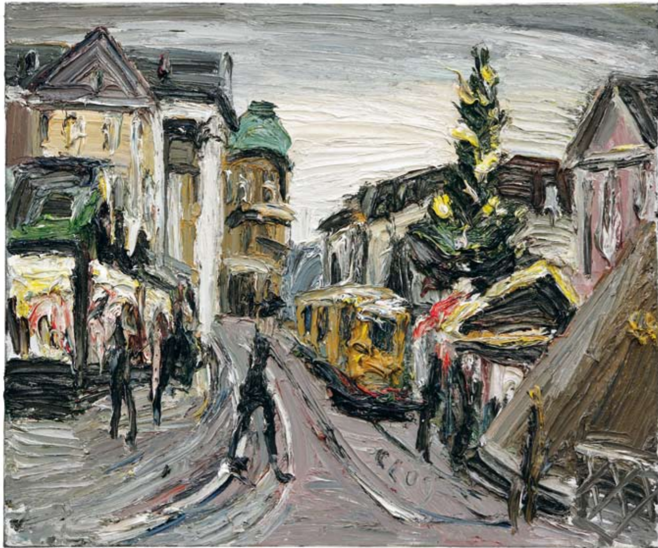
Weihnachtsmarkt 2009 Öl auf Leinwand 100 x 120 cm