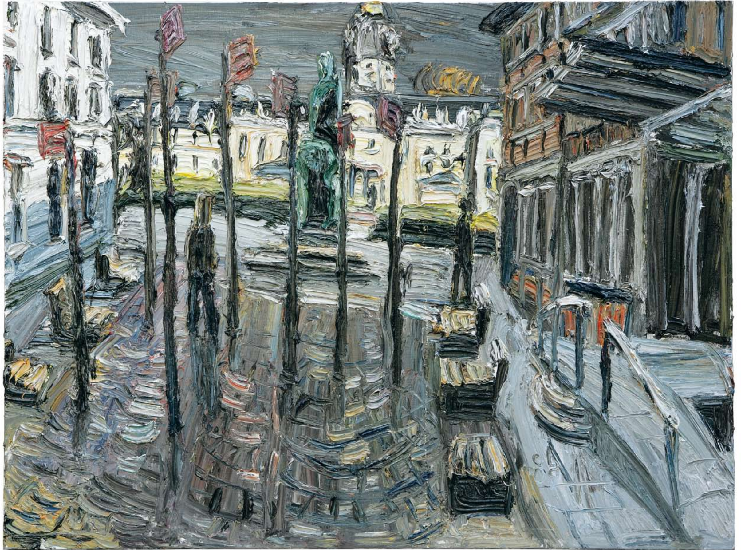
Platz der Grundrechte 2009 Öl auf Leinwand 180 x 240 cm