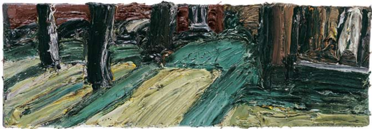
Lange Schatten 2009 Öl auf Leinwand 20 x 60 cm

Ähnlich, wie dem großen französischen Impressionisten Auguste Renoir, mag es Christopher Lehmpfuhl ergehen. Lehmpfuhl, einer jener seltenen zeitgenössischen Maler, die sich mit jeder Faser ihres künstlerischen Daseins der Plein-Air-Malerei hingeben. Jene ganz besondere Spezies von Leinwandartisten, die als Freiluft- und Landschaftsmaler aufgehen in ihrer unmittelbaren Begegnung mit der Natur, dem impressionistischen Umgang mit Licht, der Leuchtkraft und Vitalität der Farbe. Immer draußen: Mit dem Fahrrad oder Bus, der Leinwand und Ölfarben. Im Freien, allein oder unter Beobachtung von Passanten, auf der Jagd nach Momentaufnahmen und charakteristischen Merkmalen des avisierten Ortes. Bei Frühlingsluft und Sonnenschein, Regen und Schneesturm – immer mit geschultem Blick für das Hier und Jetzt. Christopher Lehmpfuhl ist ihr verfallen, dieser Mal-Passion „on tour“, sommers wie winters stets ungeschützt, ungeschönt und im wahrsten Wortsinn unverstellt.