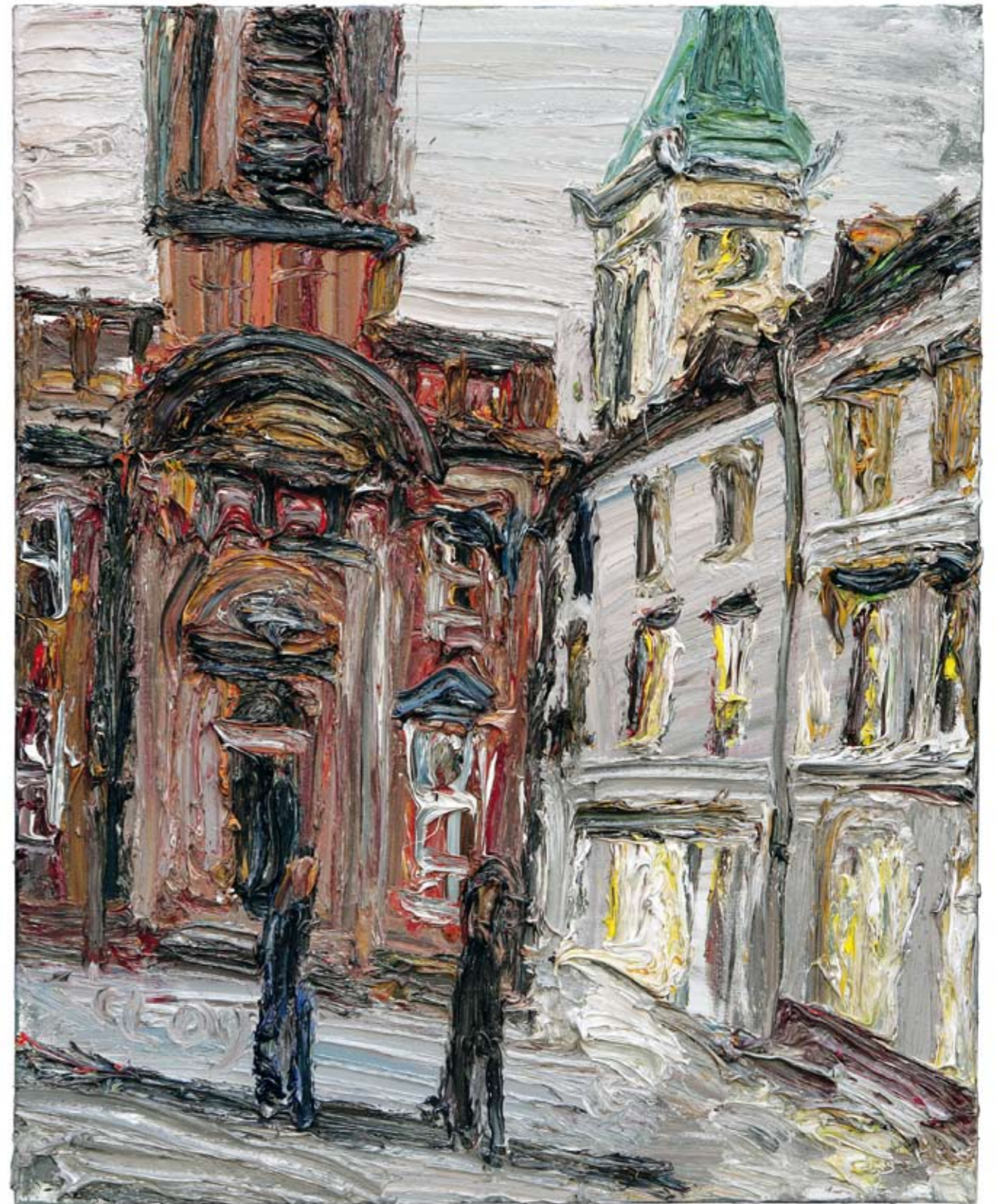
Kirche am Abend 2009 Öl auf Leinwand 120 x 80 cm