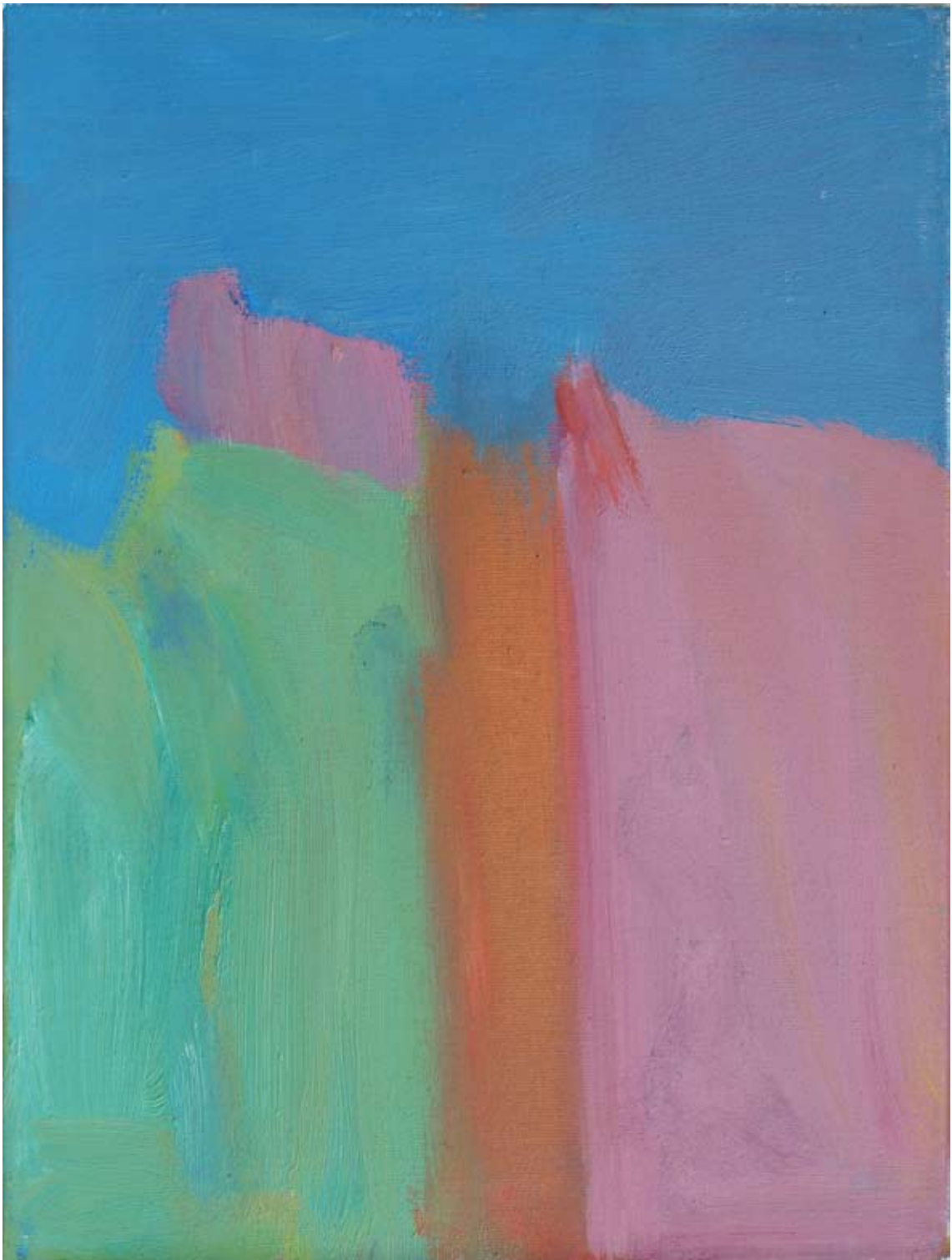
Immenried Series V, 1979, Acryl auf Leinwand, 40 x 29 cm