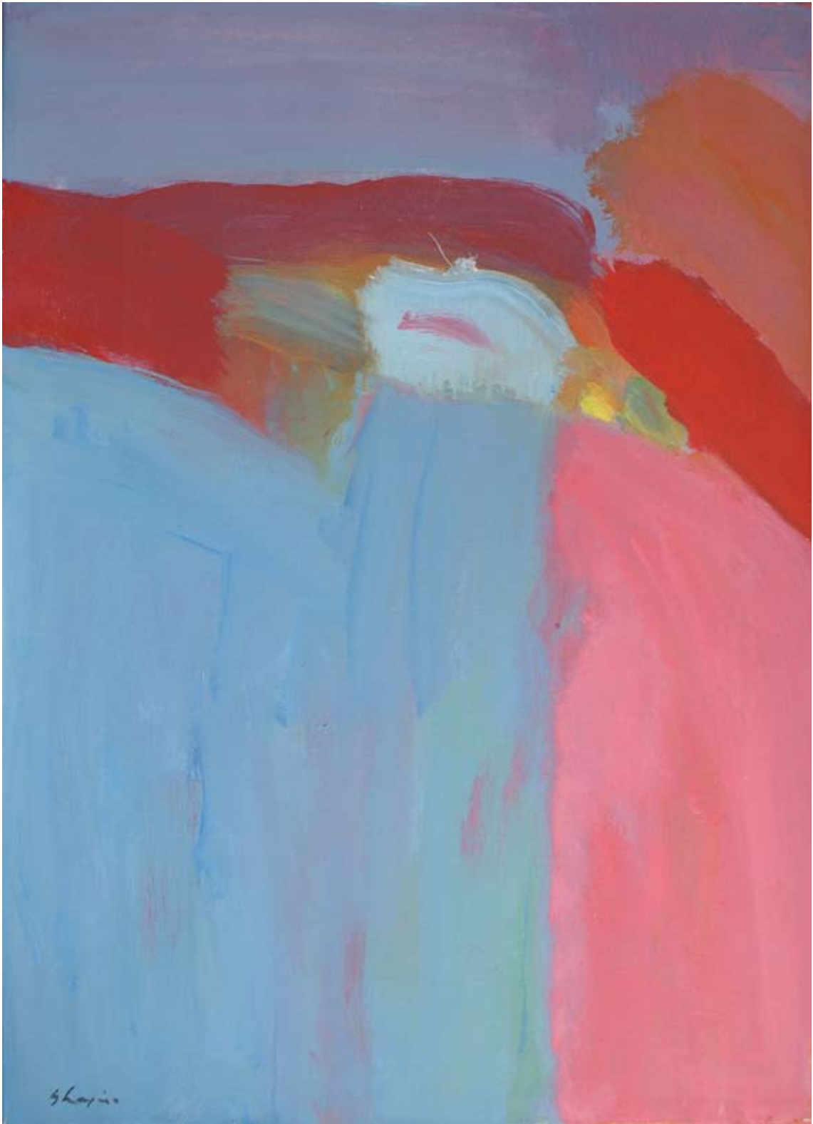
Abb. oben: Jahreszeiten V Melodie, 1981, Acryl auf Leinwand, 70 x 50 cm Abb. rechts: Landschaft, 1961, Gouache auf Papier, 30,5 x 42 cm