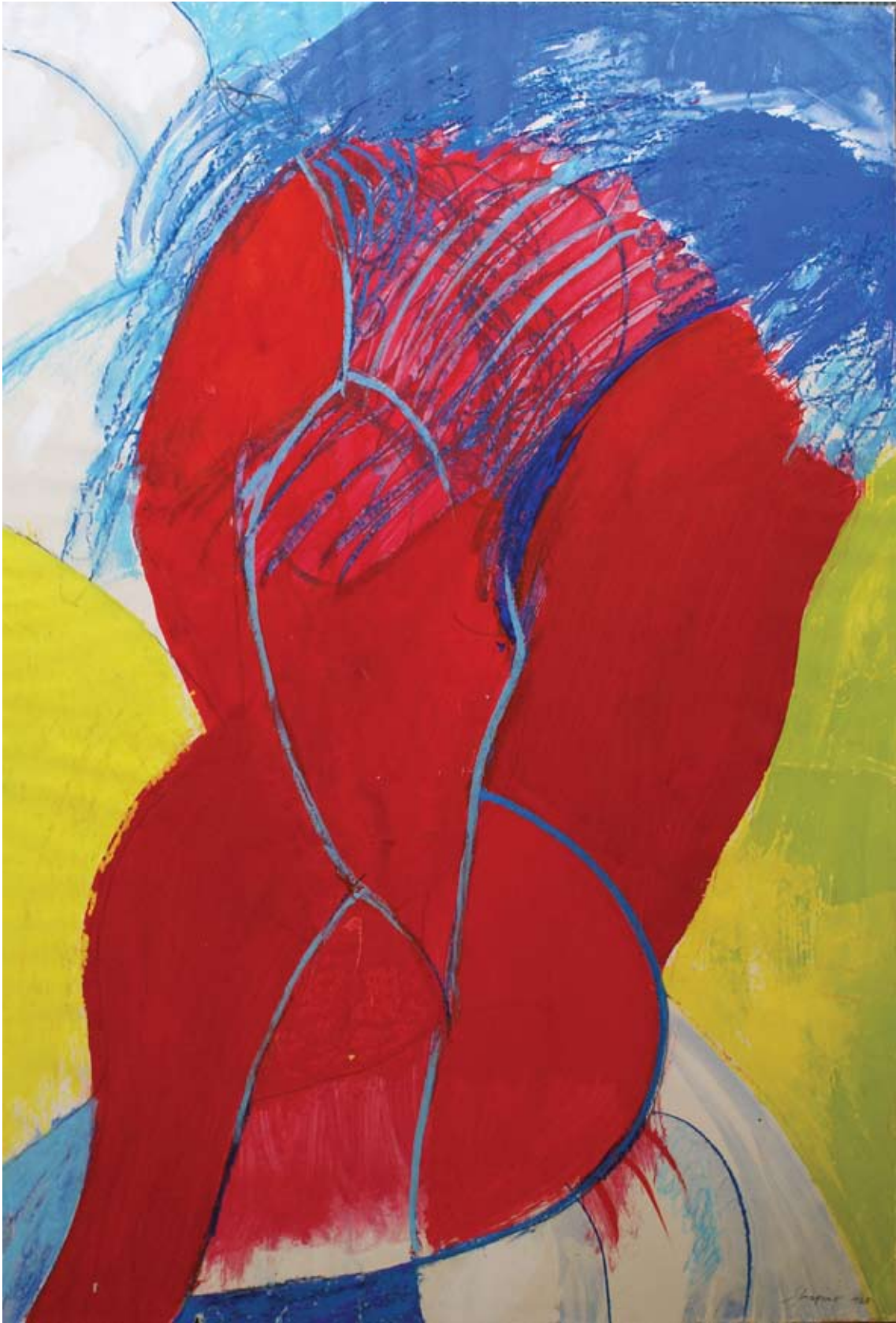
Ohne Titel, 1968, Gouache/Kreide auf Papier, 64 x 46 cm