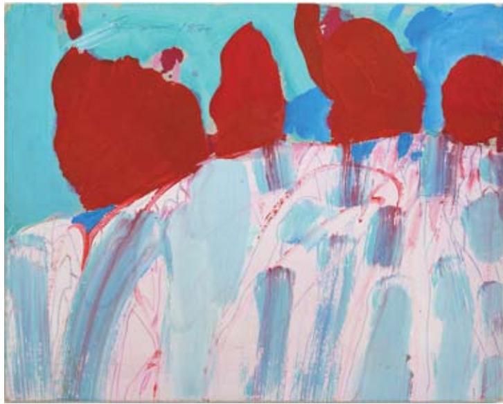
Ohne Titel, 1970, Gouache/Kreide auf Karton, 24 x 30 cm