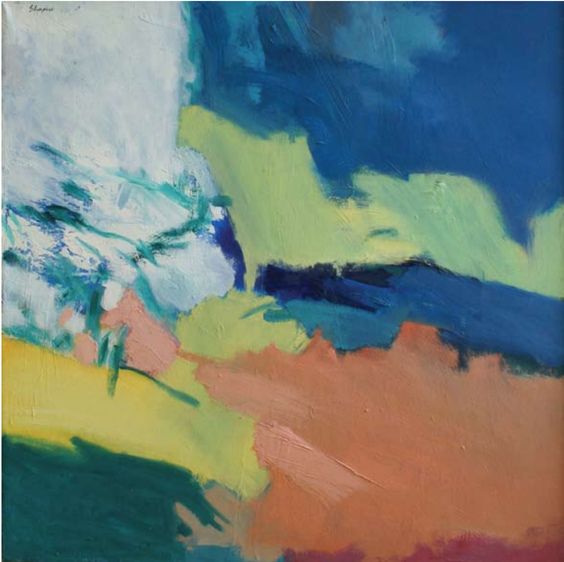
Venus, 1983, Öl auf Leinwand, 100 x 100 cm