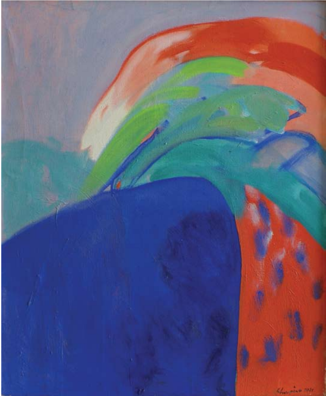
Ohne Titel, 1975, Acryl auf Leinwand, 59 x 49 cm