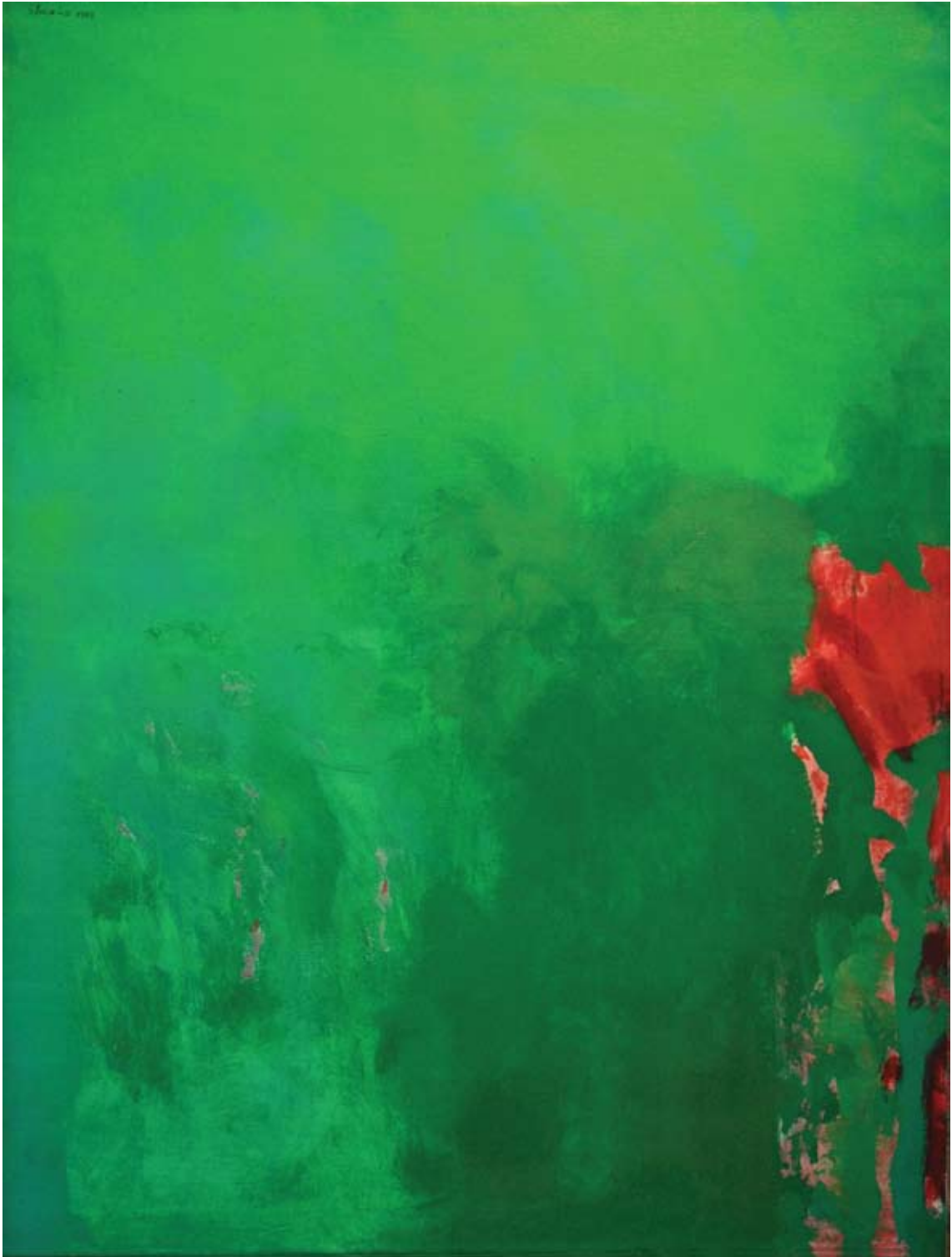
Green Series, 1973, Öl auf Leinwand, 130 x 97 cm