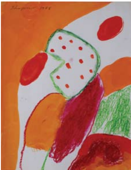
Abb. je: Ohne Titel, 1968, Gouache/Ölcreide/Papier, 27 x 21 cm