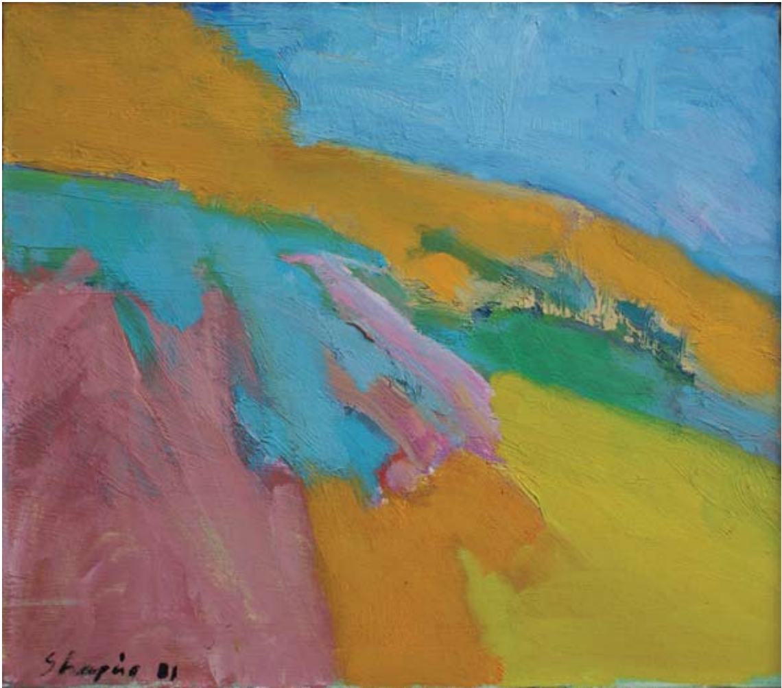
Ohne Titel, 1981, Acryl auf Leinwand, 35 x 40 cm