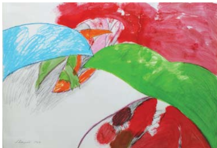
Ohne Titel, 1967, Acryl/Ölkreide auf Papier, 43 x 61 cm