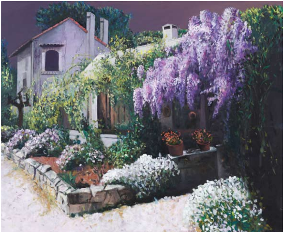
La Maison d'Anmarie I, 2008, Öl auf Leinwand, 130 x 160 cm