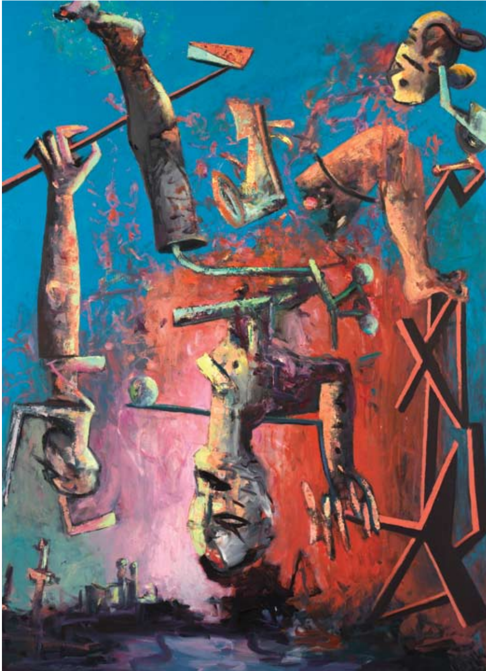
Empedocle, Marseille, 2001, Öl auf Leinwand, 190 x 140 cm Titelbild: La Belle Soeur, 2003, Öl auf Leinwand, 160 x 130 cm