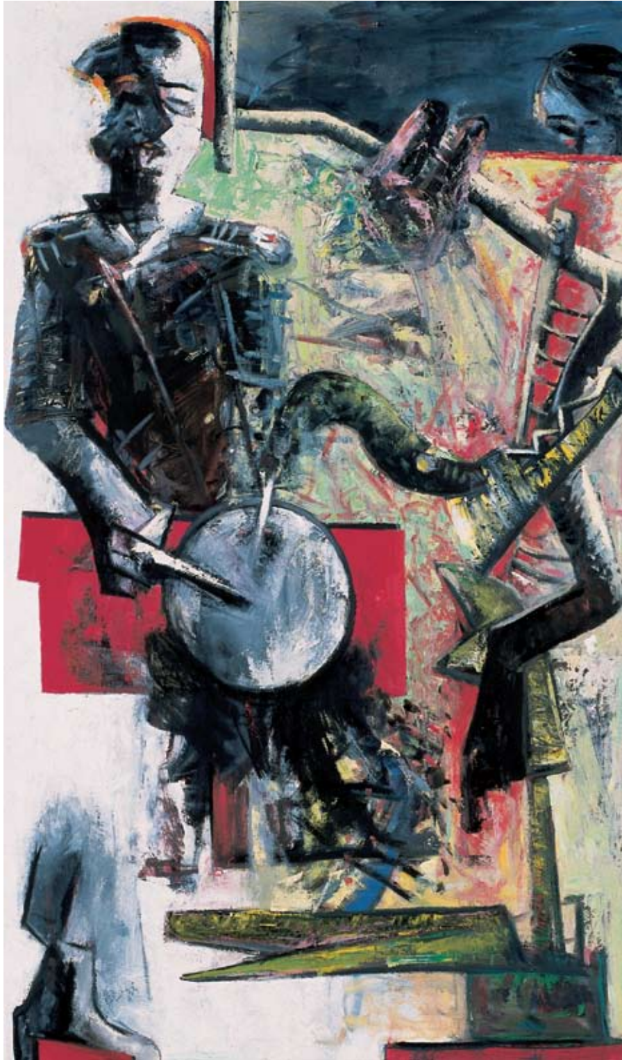
El Guerrero, 2000, Öl auf Leinwand, 200 x 120 cm