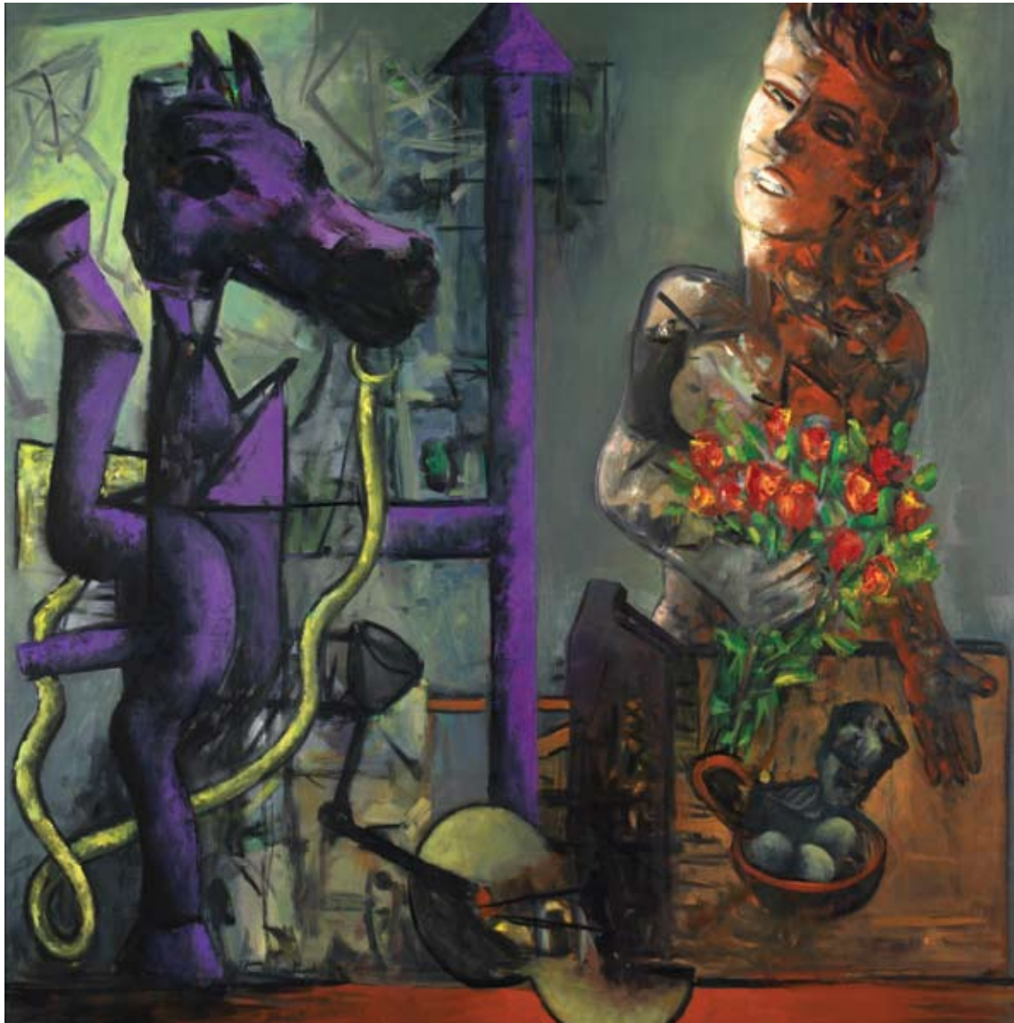
Judith, Cheval, 2004, Öl auf Leinwand, 150 x 150 cm