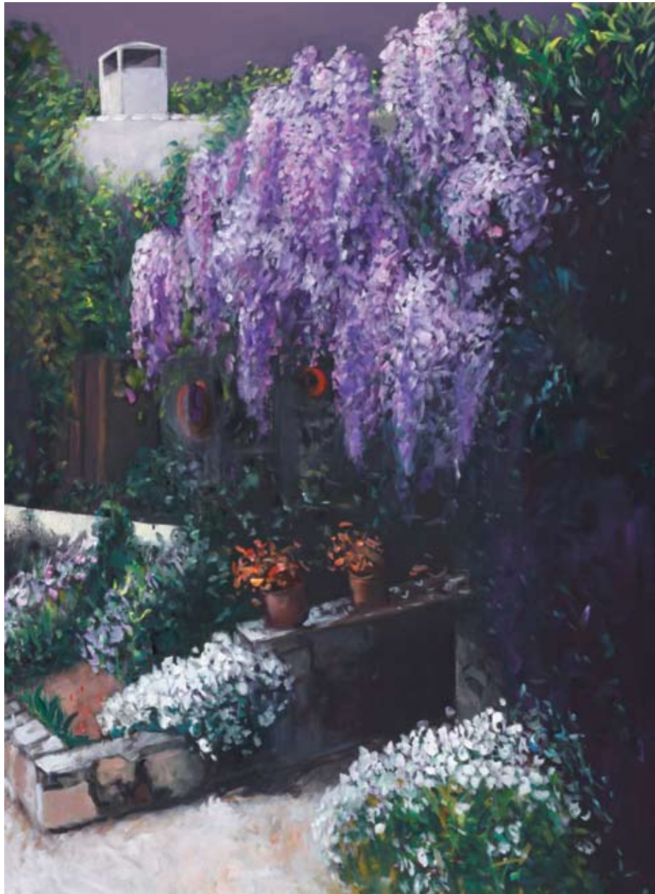
La Maison d'Annmarie III, 2008, Öl auf Leinwand, 130 x 95 cm