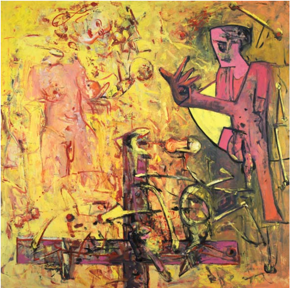
Schaufenster, Kreuz, 1994, Öl auf Leinwand, 190 x 190 cm