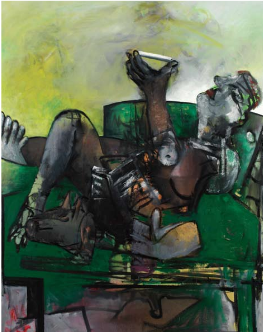
Repos, 2003, Öl auf Leinwand, 160 x 130 cm