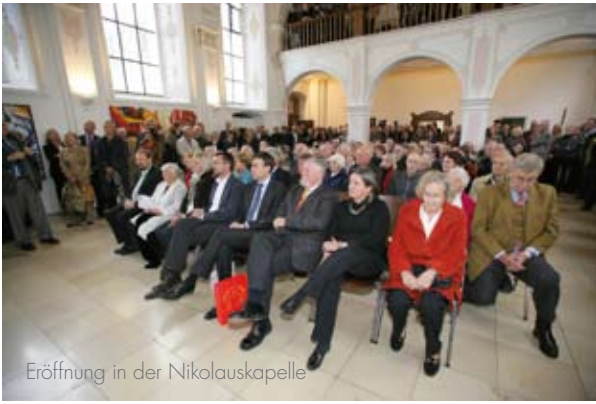
Eröffnung in der Nikolauskapelle