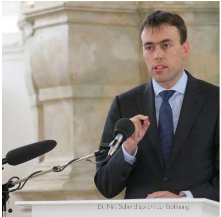
Dr. Nils Schmid spricht zur Eröffnung