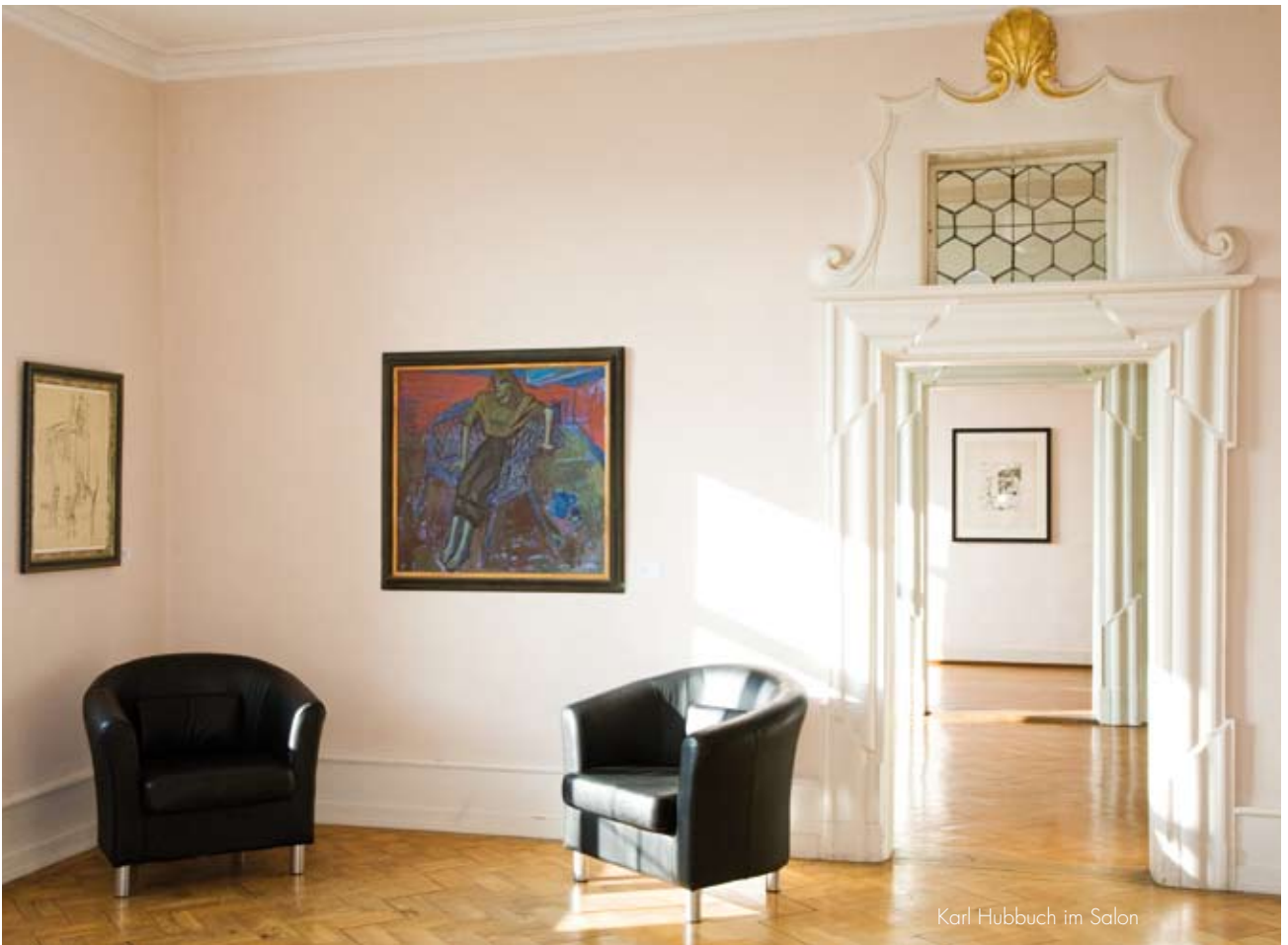
Karl Hubbuch im Salon