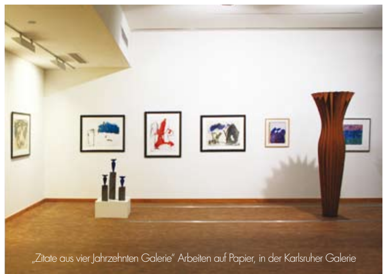
„Zitate aus vier Jahrzehnten Galerie“ Arbeiten auf Papier, in der Karlsruher Galerie