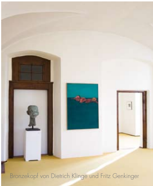
Bronzekopf von Dietrich Klinge und Fritz Genkinger