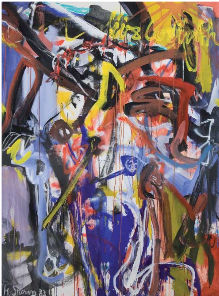
ohne Titel, Öl auf Leinwand, 1983, 170 x 124 cm

Zahlreiche Einzelausstellungen machen Helmut Sturm seit den frühen sechziger Jahren in Deutschland bekannt. Seinen internationalen Ruf stützen vor allem Gruppenausstellungen, insbesondere mit den Gruppen „SPUR“ und „GEFLECHT“.