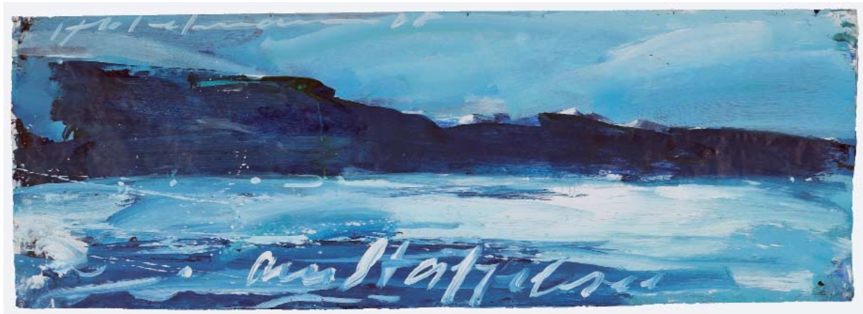
Am Staffelsee, 2008, Acryl auf Papier, 43 x 123 cm