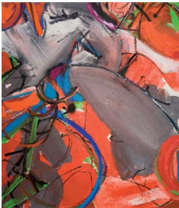
Gegenlauf der Welt, 2009, Öl auf Leinwand, 115 x 100 cm

Heiko Herrmann lebt in München und Pertolzhofen.