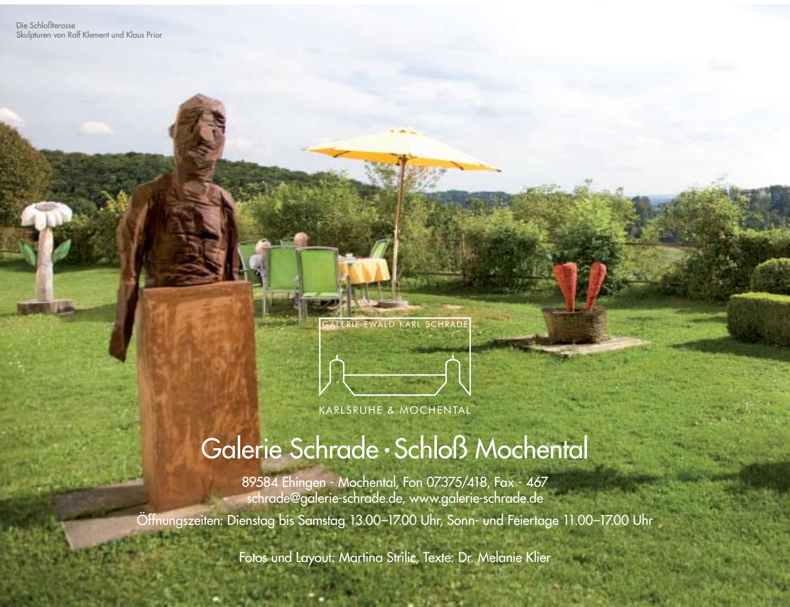
Die Schloßterasse Skulpturen von Ralf Klement und Klaus Prior