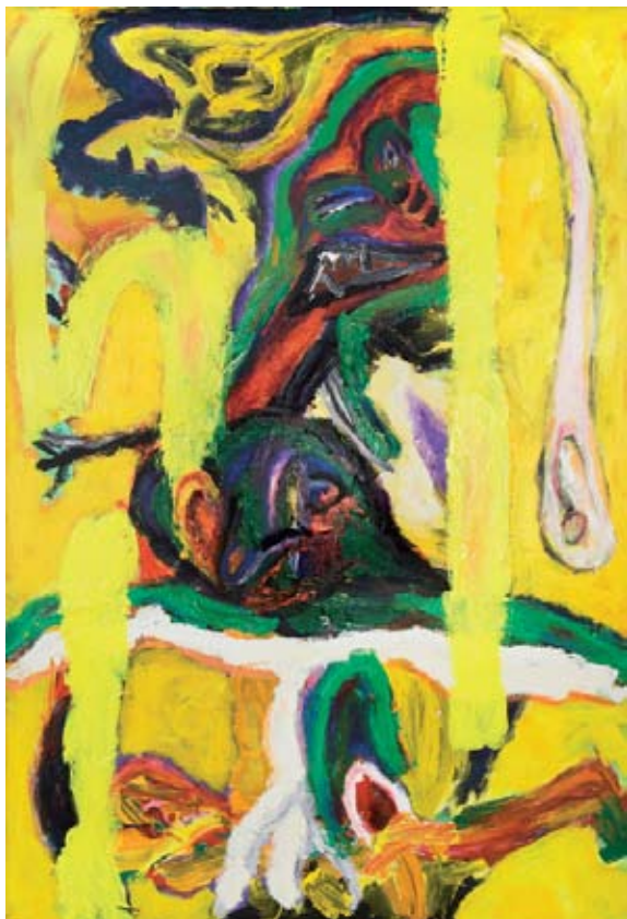
ohne Titel, 1991, Acryl auf Leinwand, 190 x 130 cm

Franz Hitzler lebt in München und im Allgäu.