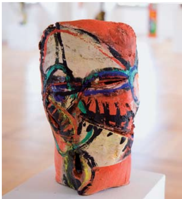
Deora, 1997, Terracotta auf Acryl, 35 x 20 x 18 cm

„Ich fange ein Bild an mit Grundformen oder Flecken, um gegen die leere Leinwand anzukämpfen, (...). Dann bringe ich auf die Flecken eine Antwort, einen Kontrapunkt oder setze eine Addition dazu. (...) So entsteht Frage und Antwort und das läuft über Farbe und Zeichnung ab. Das schichtet sich über mehrere Farbraumschichten, wodurch ein Vorne und Hinten entsteht. Dann gibt es Momente, in denen das Bild Eigenleben entfaltet, wo man aufhören könnte. Das ist mir aber zu steril. Dem Fluß, der im Bild entstanden ist, will ich noch eins draufsetzen, dass ein Überfluß entsteht.“