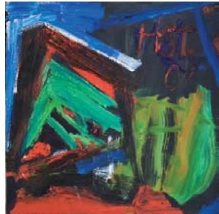
ohne Titel, Öl auf Leinwand, 2003, 80 x 80 cm