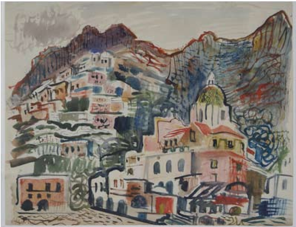
Positano, 1931, Aquarell, 44.8 x 57.9 cm