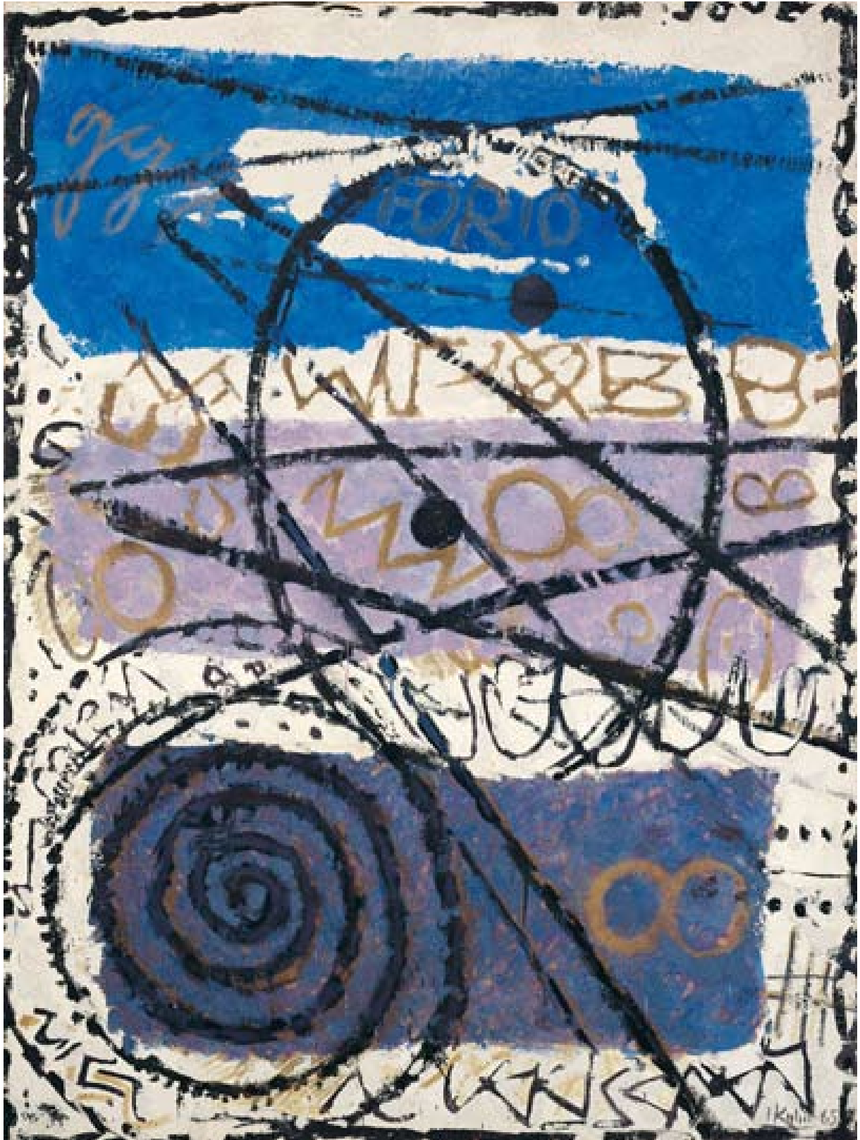
Forio, 1965, Spachtel-Mischtechnik auf Leinwand, 200 x 150 cm