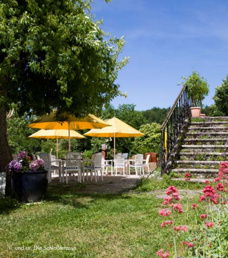
li. und re. Die Schloßterasse