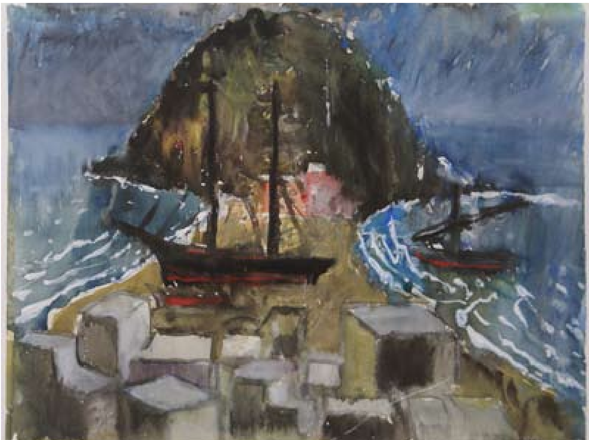
St Angelo, 1931, Aquarell, 34.2 x 46.9 cm

Der übertriebene Run, nix wie rein in den Süden, brach aus.