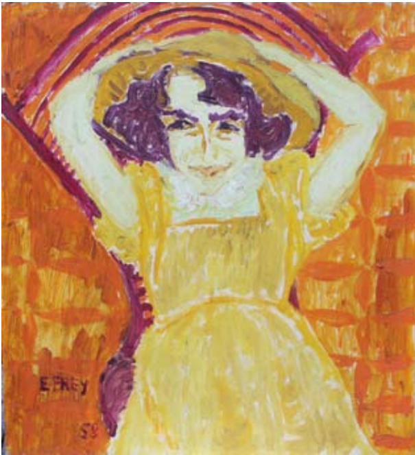
Eleonore Frey-Hanken, „Bildnis Eleonora“, 1958, Öl auf Hartfaser, 65x59 cm