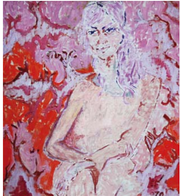
Eleonore Frey-Hanken, „Margret die Dänin“, 1970, Öl auf Hartfaser, 88x80 cm