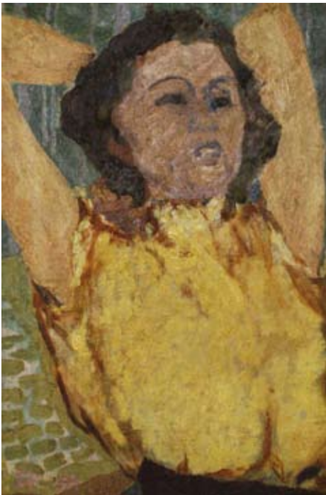
Eleonore Frey-Hanken, „Fräulein Bertsch“, 1954, Öl auf Leinwand, 60x40cm

Solche Bilder wirken durch ihre unmittelbare Lebendigkeit; die Malerin schuf nicht simple Abbilder, sondern individuelle Charaktere. Eleonore Frey-Hankens Bildnisse sind kaum je „schön“, wohl aber wahrhaftig zu nennen – bei ihr wird das Porträt zum Psychogramm.